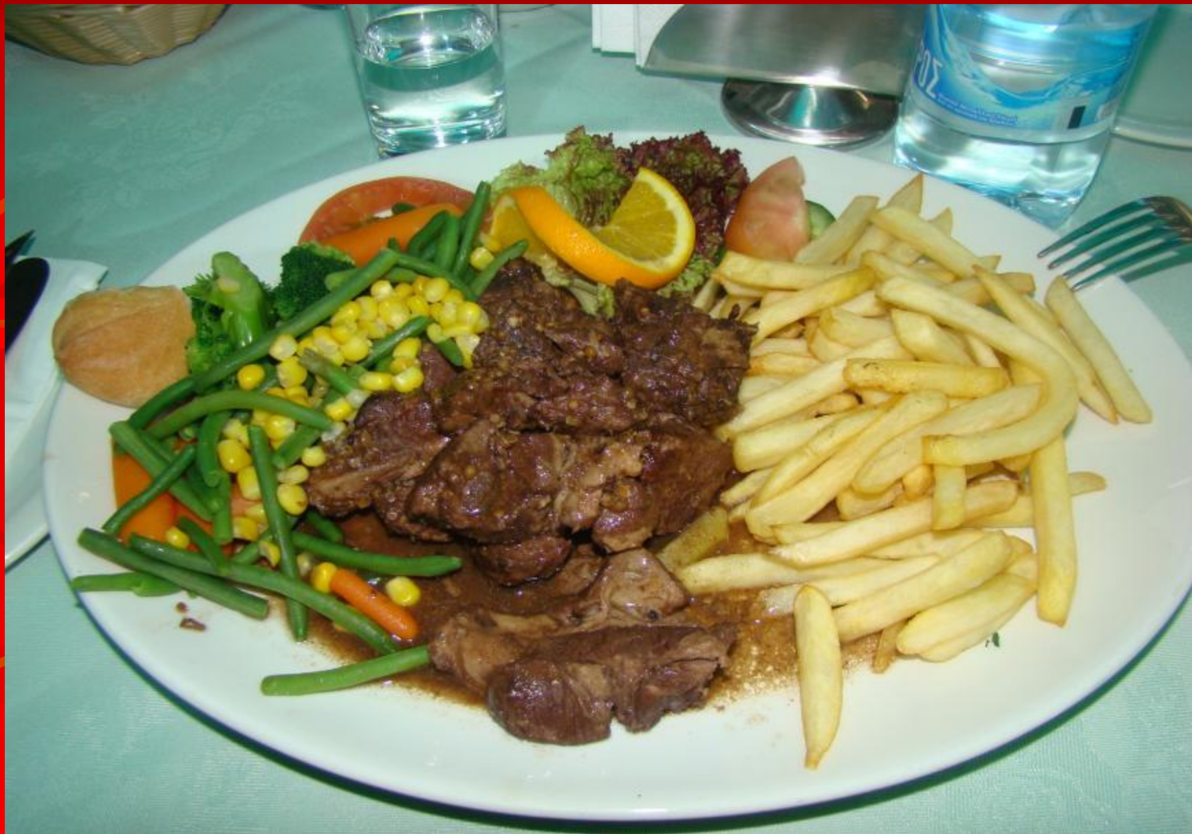
Еда на «халяву»