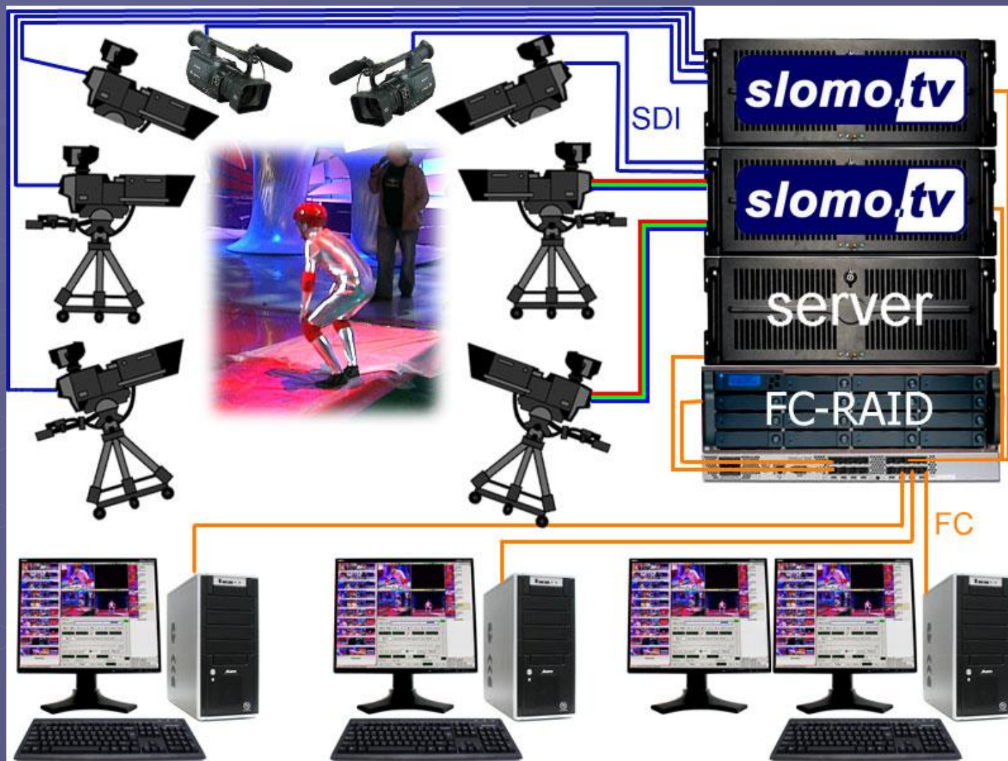
Схема процесса безленточного производства цикловой передачи