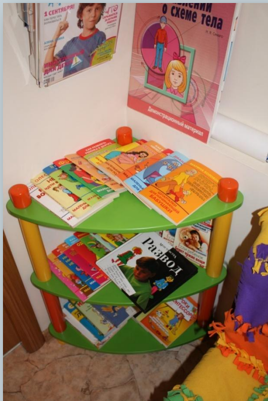
Библиотека для родителей