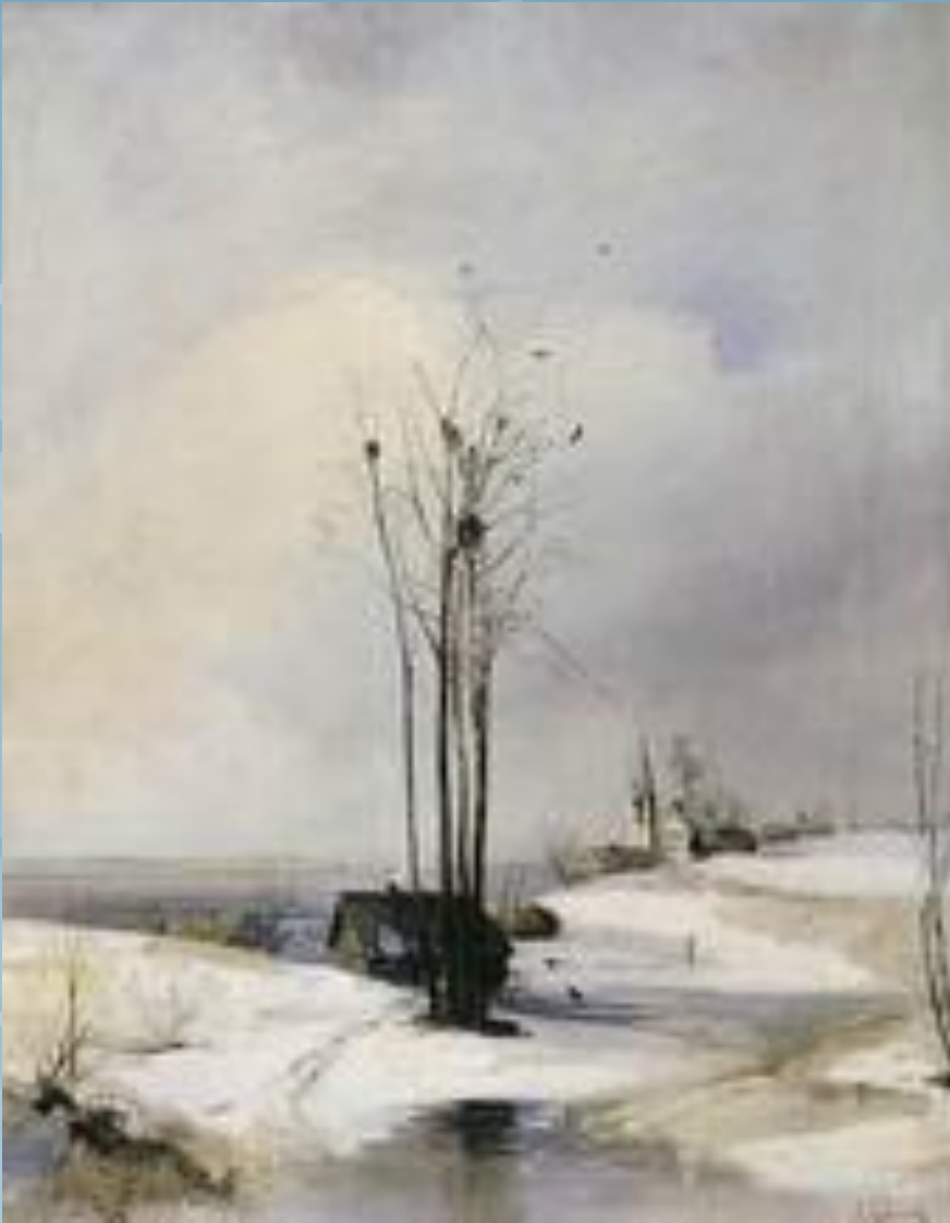
Ранняя весна. Оттепель. 1880-е гг.

То мороз, То лужи голубые, То метель, То солнечные дни. На пригорках Пятна снеговые Прячутся от солнышка В тени. Над землёй- Гусиная цепочка, На земле — Проснулся ручеёк, И зиме показывает Почка Озорной, зелёный Язычок.