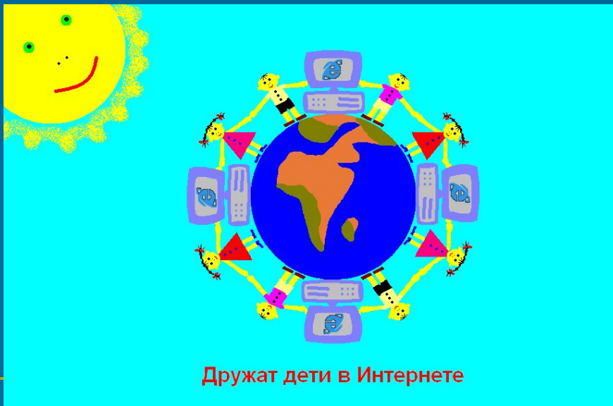
Дружат дети в Интернете

Заслужил авторитет В нашей жизни Интернет И сегодня знают дети Многое об Интернете. Интернет – большой сундук. В сундуке – от всех наук Информация хранится. Надо только не лениться, И решат за вас проблемы Поисковые системы.