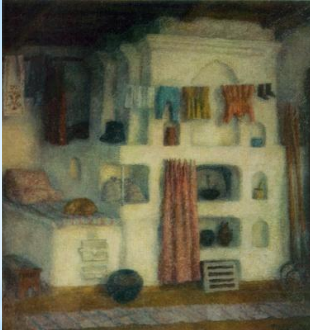
Старая теплая печь