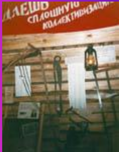
Фото-галерея «Коллективизация в СССР»