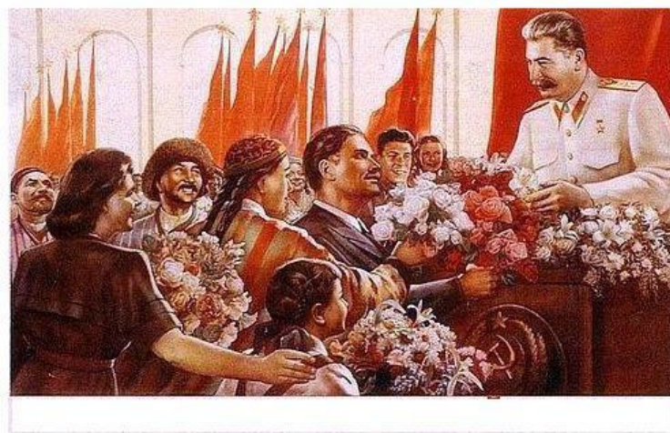
Фото-галерея «Коллективизация в СССР»

В начале января 1928г. по настоянию Сталина Политбюро ЦК проголосовало за применение чрезвычайных мер к крестьянам, «скрывающим» излишки зерна... В деревни посылались вооруженные отряды, которые проводили незаконный захват зерна и аресты, закрывали рынки и пытались насильно загнать крестьян в коммуны. ...В деревне начались крестьянские бунты, которых только в Московской области было зарегистрировано более 2 тысяч.