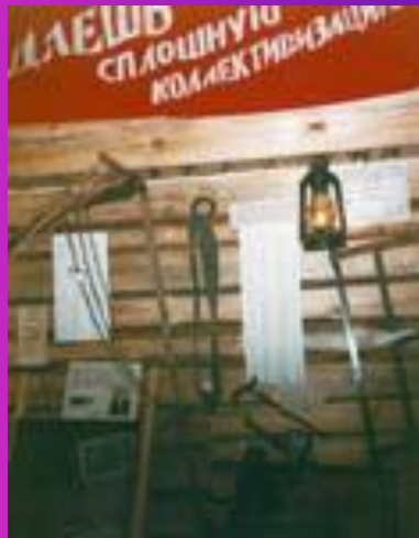
Фото-галерея «Коллективизация в СССР»