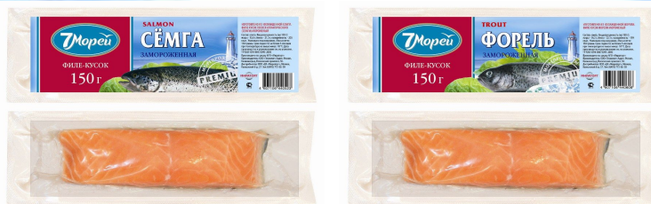
Задний вид упаковок филе и ломтиков