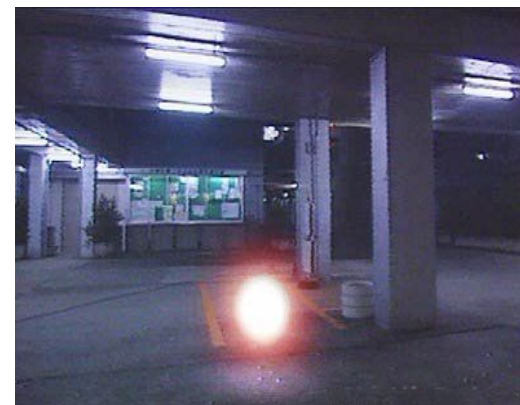
Единственный существующий сейчас «шаромолниеотвод»

Если же шаровая молния задела кого-то и человек потерял сознание, то его необходимо перенести в хорошо проветриваемое помещение, тепло укутать, сделать искусственное дыхание и обязательно вызвать скорую помощь. Вообще же, технические средств защиты от шаровых молний как таковых пока не разработано.