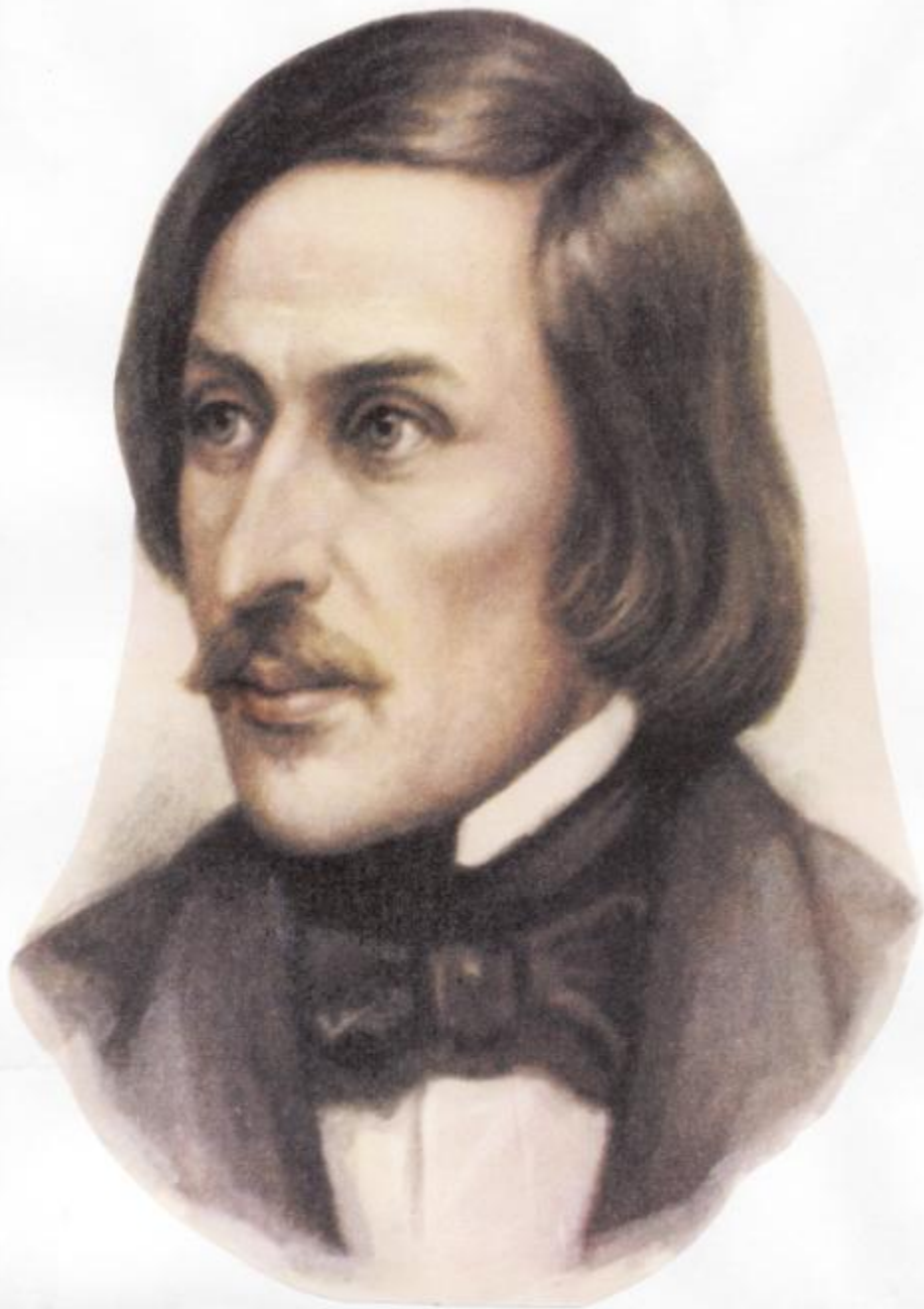
Николай Васильеви ч Гоголь