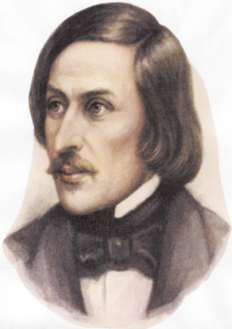
Николай Васильев ич Гоголь