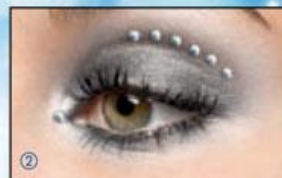
Вариант 2. Под линией бровей