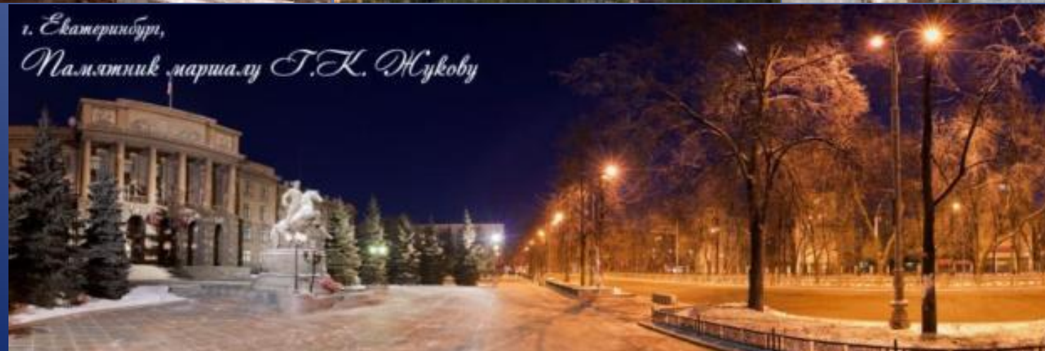
г. Екатеринбург, Памятник маршалу С.К. Жукову