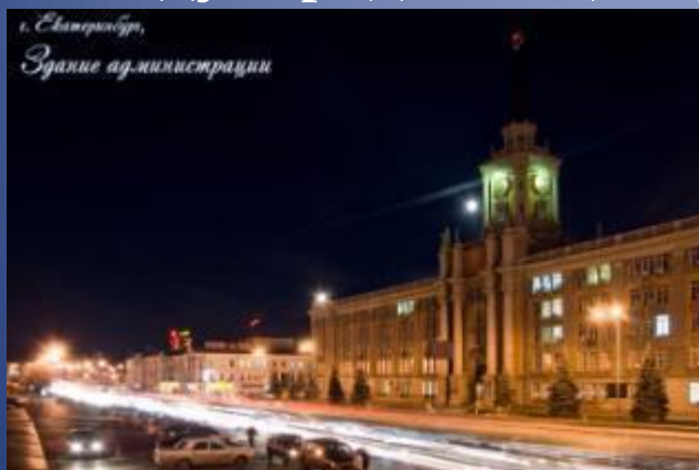
г. Екатеринбург, Здание администрации

Находясь в центре России, на пересечении границ Европы и Азии, Екатеринбург обладает огромными перспективами международного центра торговли и культурного обмена.