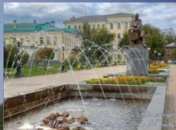
г. Екатеринбург, Мансуровский фонтан