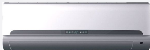
Серия Ozon: 7, 9, 12, 18, 24 кВт