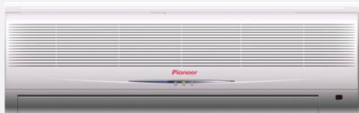
Серия Breeze: 5, 7, 9, 12, 18, 24 кВт