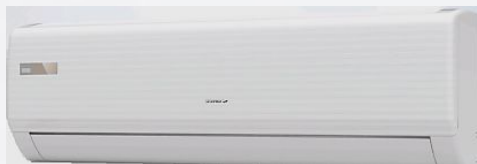
Серия Calipso: 7, 9, 12, 18, 24 кВт