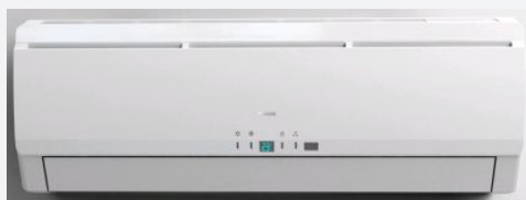
Серия Invertor: 9, 12, 18 кВт

В 2012 году расширение модельного ряда OEM Pioneer - три новых серии оборудования: