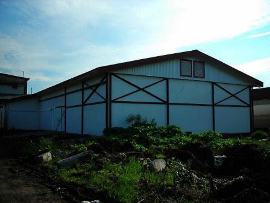
Модульное здание склада для хранения дикоросов.