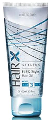
HairX Styling Flex Style Hair Gel Моделирующий гель для волос «Эксперт»