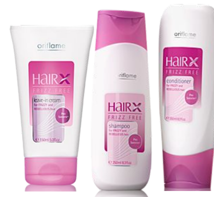
Серия для непослушных волос «Эксперт – шелковая гладкость»