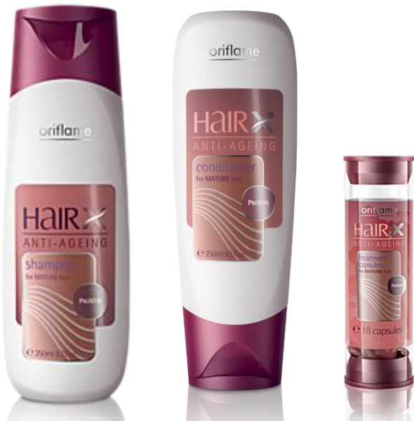
Серия «Эксперт - Формула молодости»