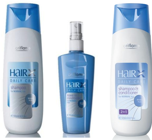
Серия для частого использования «Эксперт – Ежедневный уход»