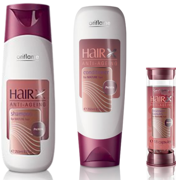
Серия «Эксперт - Формула молодости»