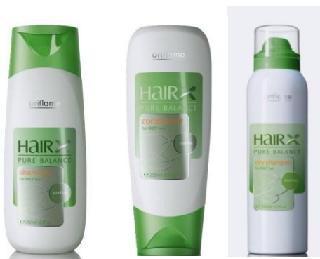
Серия для жирных волос «Эксперт – Баланс»