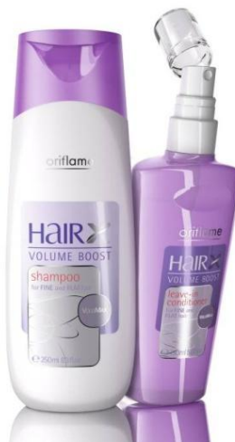
Серия для тонких волос «Эксперт -Объем»