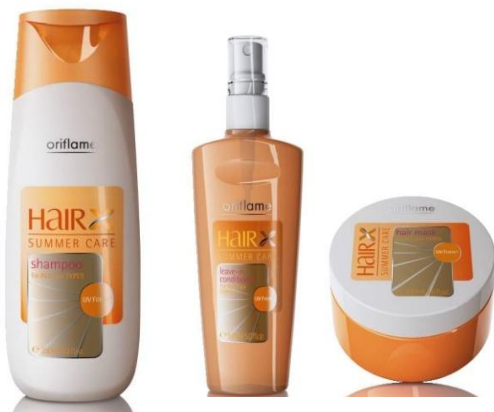
Серия «Эксперт – Солнцезащитный»