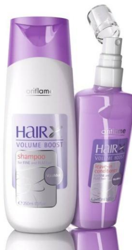
Серия для тонких волос «Эксперт -Объем»