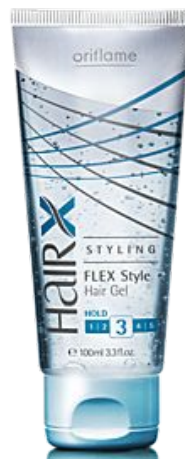
HairX Styling Flex Style Hair Gel Моделирующий гель для волос «Эксперт»