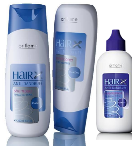
Серия «Эксперт – Защита от перхоти»