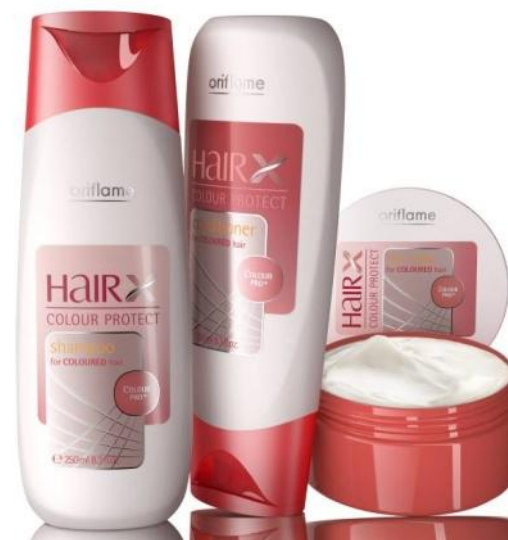
Серия «Эксперт – Защита цвета»