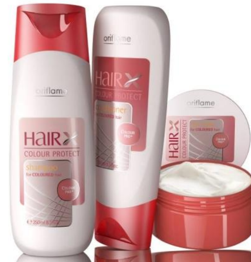
Серия «Эксперт – Защита цвета»