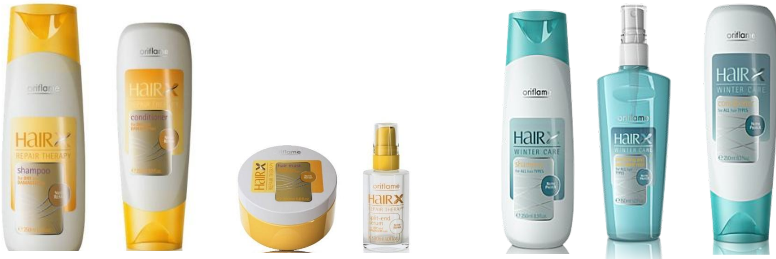
Серия «Эксперт - Восстановление»