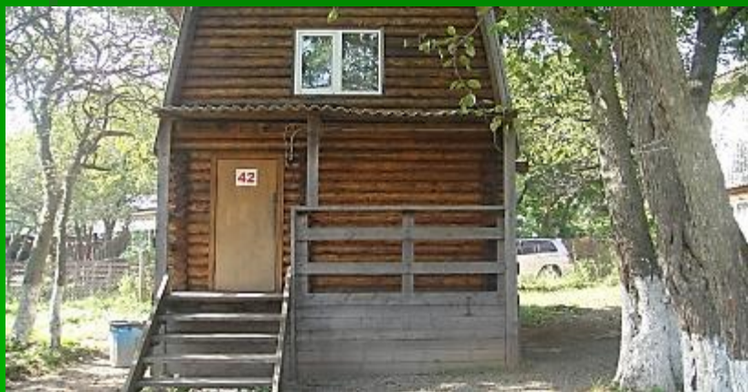
▪ 6-ти местный домик (фасад)