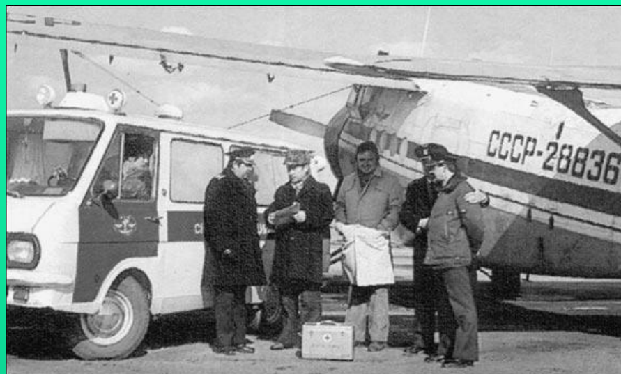
В 1988 году, когда случилось страшное землетрясение в Армении, «неотложку» из Удмуртии направили в самый эпицентр - в Спитак.

В сентябре в Воткинск прибыли первые американские инструкторы для наблюдения за прекращением производства ракет "СС-20" на машиностроительном заводе,