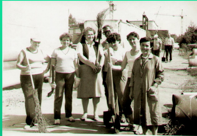
Коллектив Тепловых сетей на субботнике

В те годы в тепловых сетях коллектив был небольшой, но очень дружный: вместе работали, вместе отдыхали. Город рос, а вместе с ним росли и теплосети. Хочется отметить энтузиазм с которым мы трудились, взаимопонимание, чувства значимости нашей работы и гордости за свое дело. За годы, прошедшие со дня основания, вырос авторитет Тепловых сетей, весомее стал их вклад в теплоснабжение городов республики.