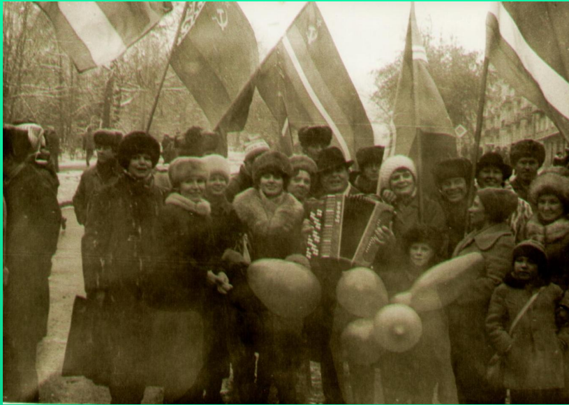
Коллектив Тепловых сетей на демонстрации в честь Великой Октябрьской Революции 07.11.1987г.