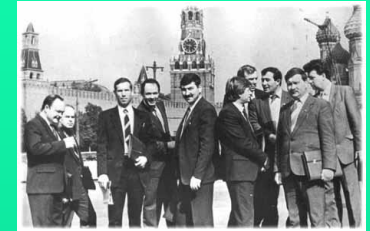
Народные депутаты СССР от Удмуртии на Красной площади в Москве, в дни работы I съезда народных депутатов. Июль 1989 г.

Жителей Удмуртии, как и всего СССР, охватила мода на занятия восточными боевыми искусствами. Более 600 человек участвовало в феврале 1989г. в I республиканском фестивале У-шу, прошедшем в Ледовом дворце г.Ижевска.