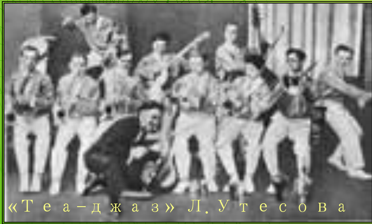
«Т е а - д ж а з» Л. У т е с о в а

собрал музыкантов и стал готовить джазовую программу. 8 марта 1929 года на сцене Малого оперного театра (г. Ленинград) дебютировал театрализованный джаз Леонида Утесова с программой «Теа-джаз».