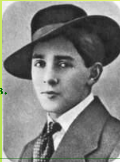
А.Утесов 1911 год

В 1912 году устроился в Кременчугский театр миниатюр; тогда же взял сценический псевдоним Утесов.