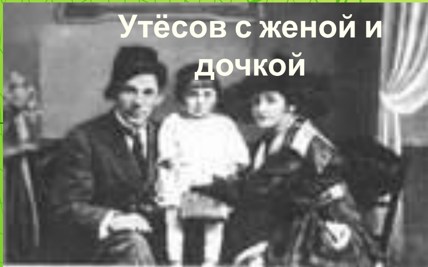
Утёсов с женой и дочкой