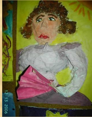
Использование барельефных изображений

Использование разных видов коллективных работ: