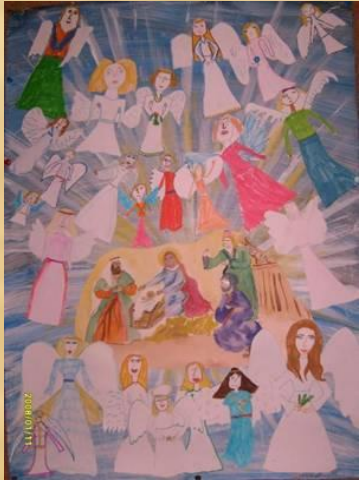
Совмещение разных материалов