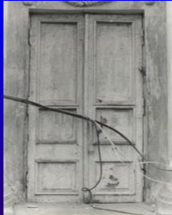
Касса. Вход в кассу театра