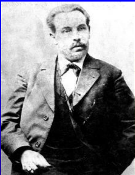
Первый антрепренёр театра СЕМЁН ИВАНОВИЧ ТОМСКИЙ