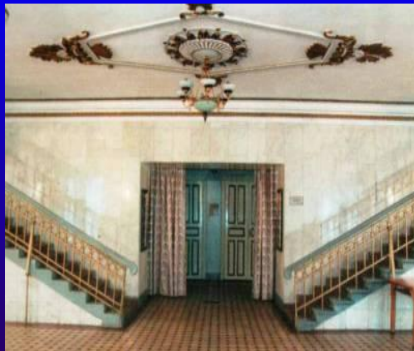
Вход в партер