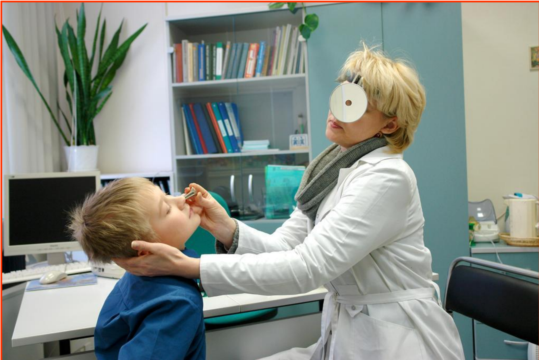
На приеме у ЛОРа.