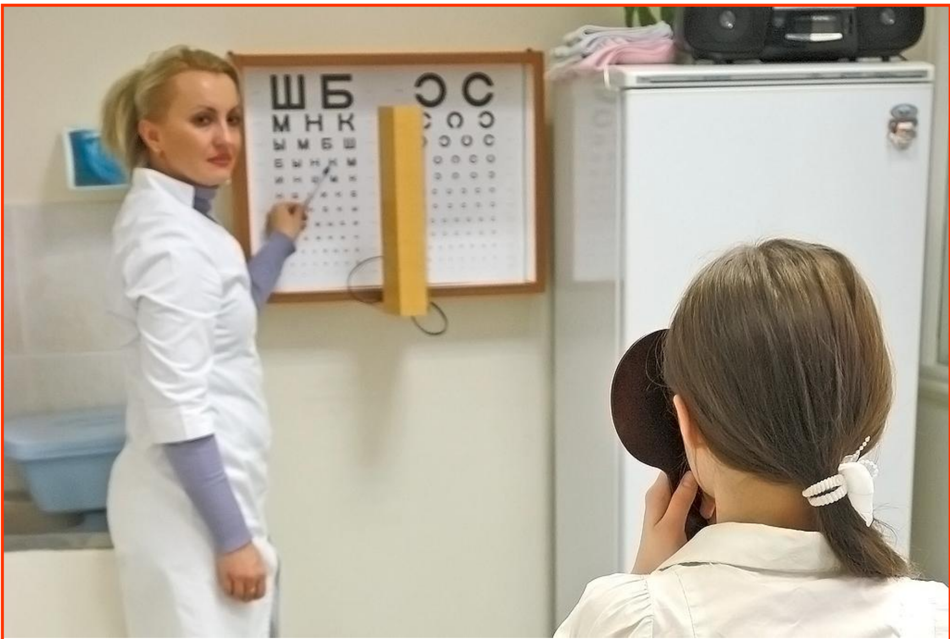
Обследование у окулиста. Проверка остроты зрения.