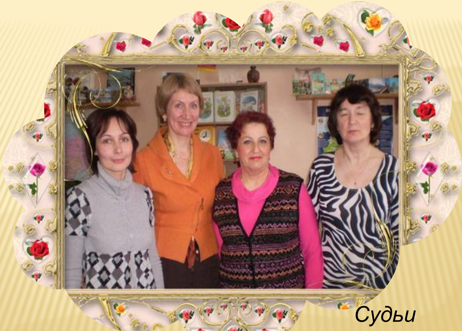
Судьи чемпионата - лучшие учителя немецкого языка