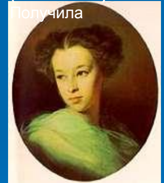
Младшая дочь, Наталья Александровна Пушкина (1836-1913г.)