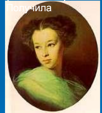
Младшая дочь, Наталья Александровна Пушкина (1836-1913г.)