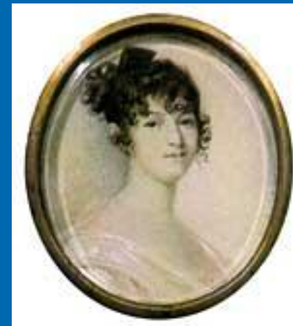
Мать, Надежда Осиповна Пушкина (1775-1836г.)