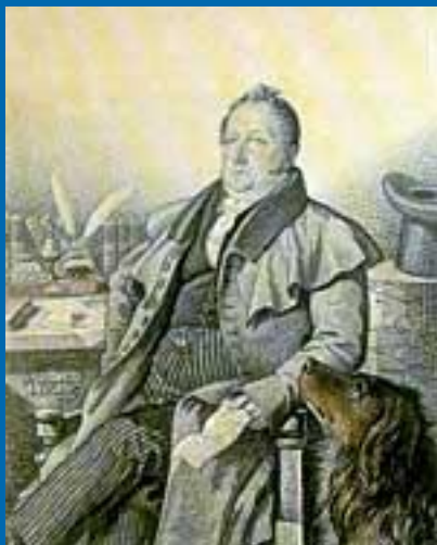
□ Отец, Сергей Львович Пушкин (1770-1838г. )