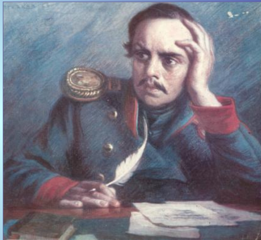
Портрет М.Ю. Лермонтова. Худ. Б.Щербаков.