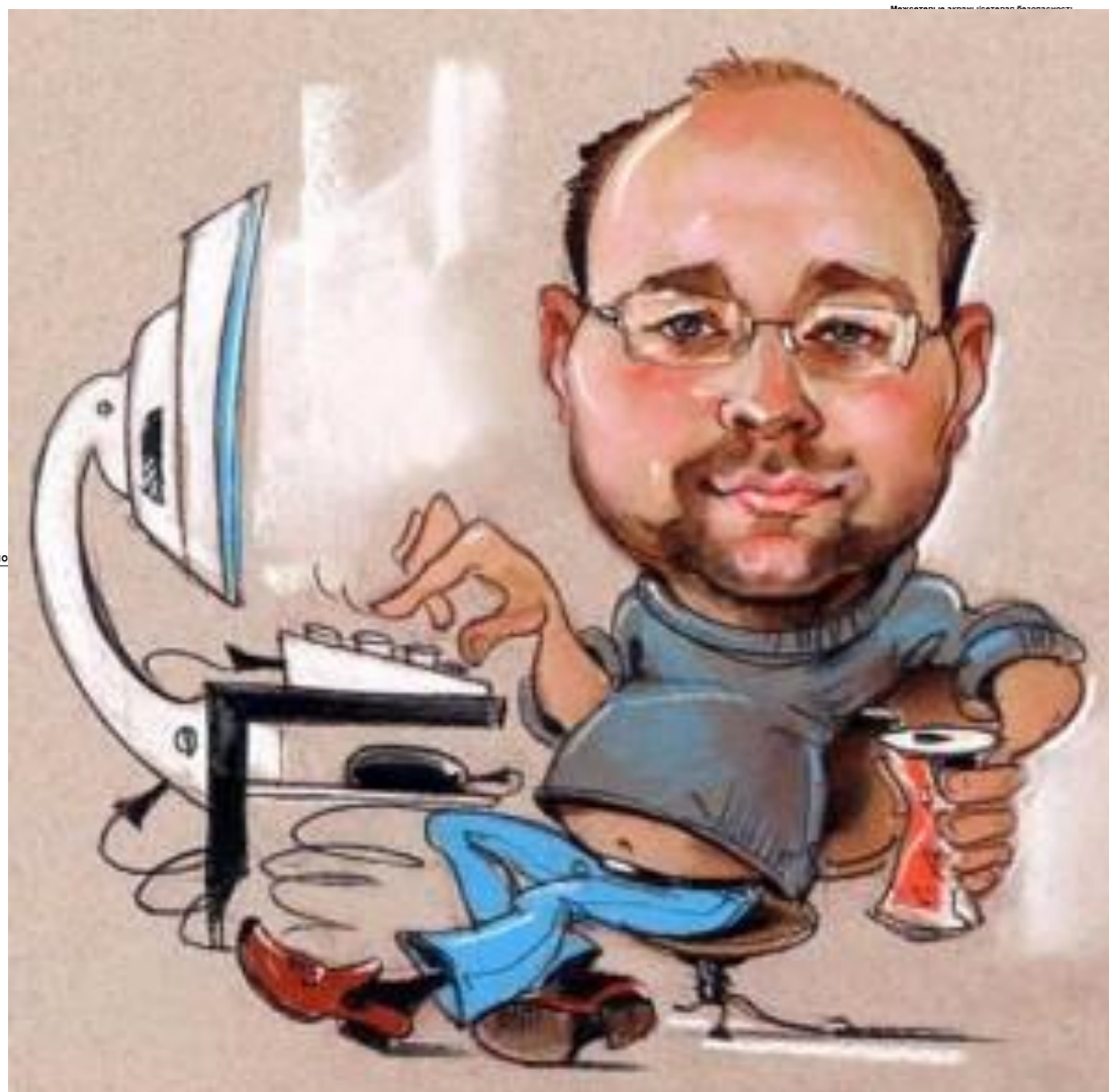
Оценка эффективности СИ