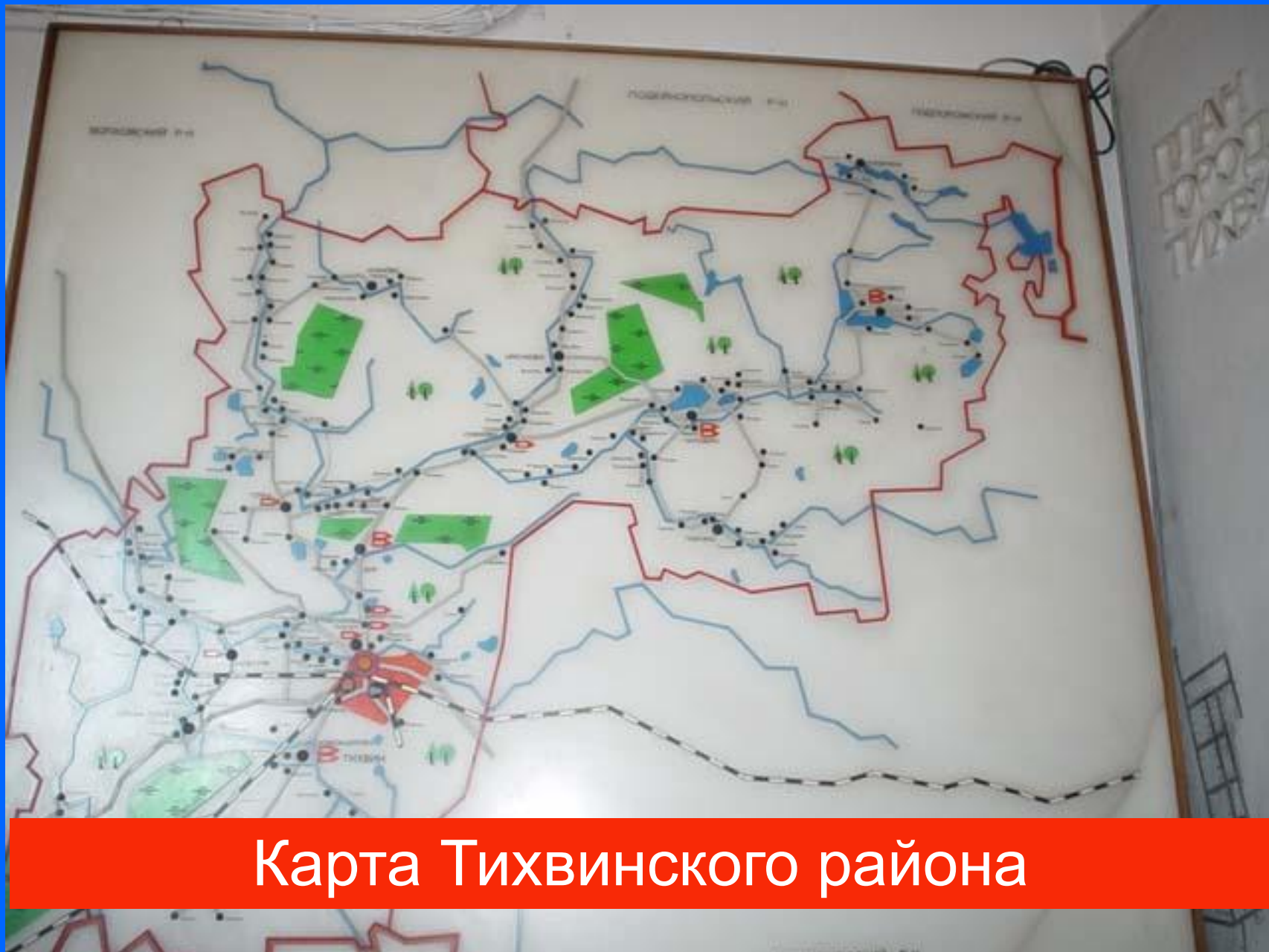
Карта Тихвинского района