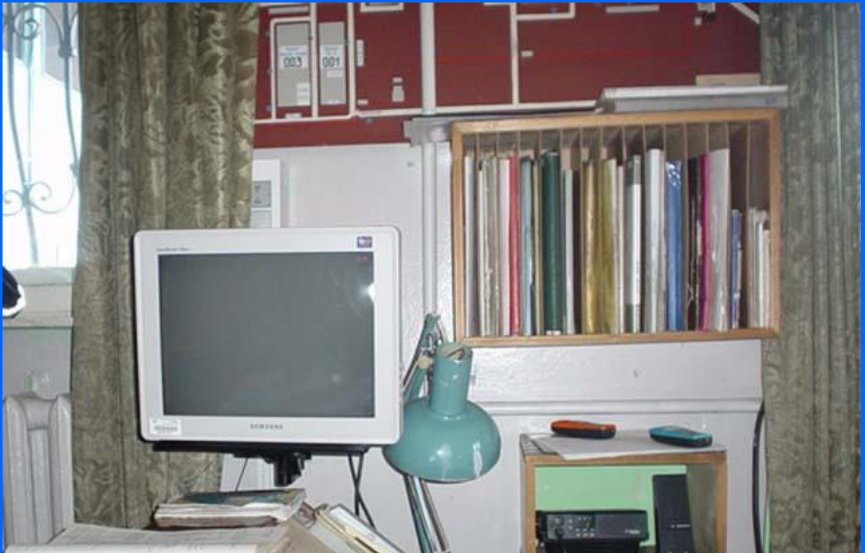
Монитор автоматической пожарной сигнализации и радиостанция