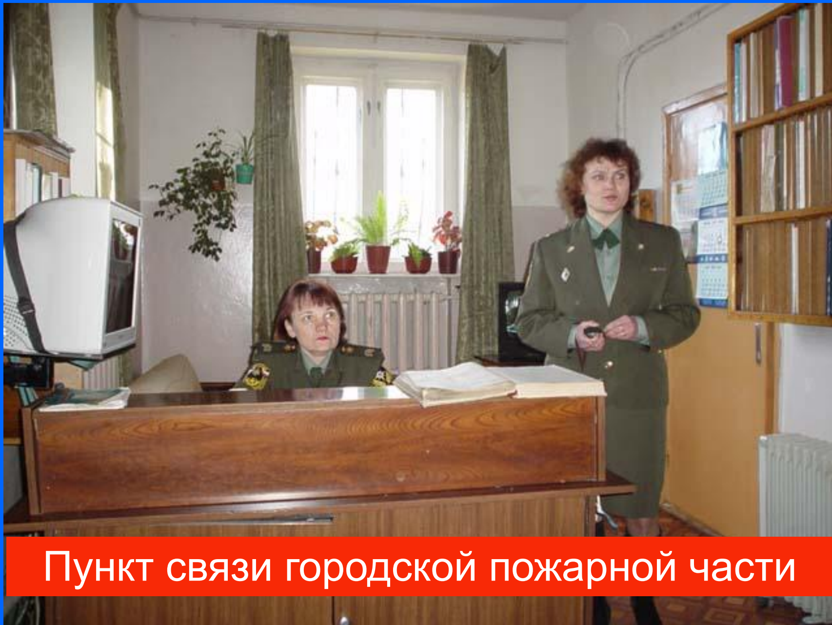
Пункт связи городской пожарной части