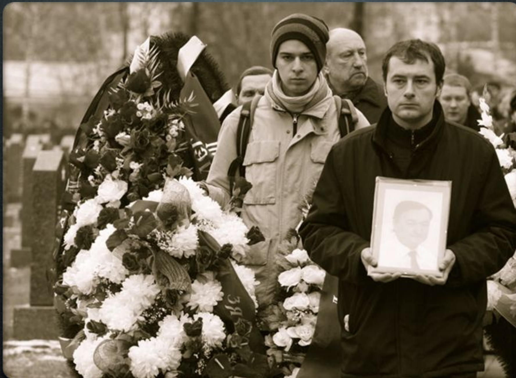
Похороны Сергея Магнитского, 20.11.2009