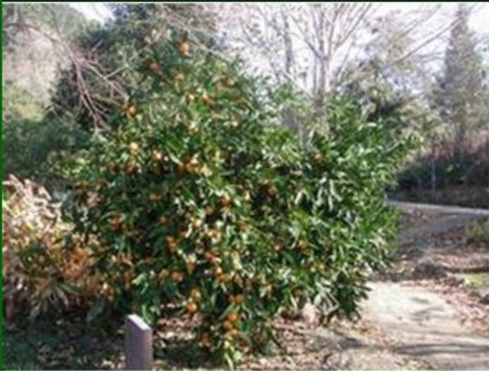
μανταρίνι, το - мандарин