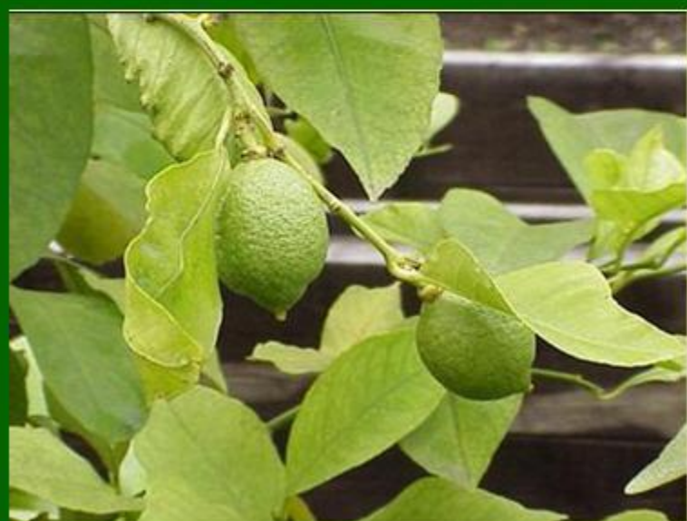
Λεμόνι, το - Лимон