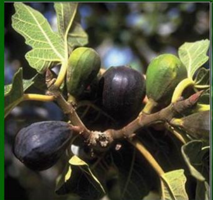
σύκο, το- инжир