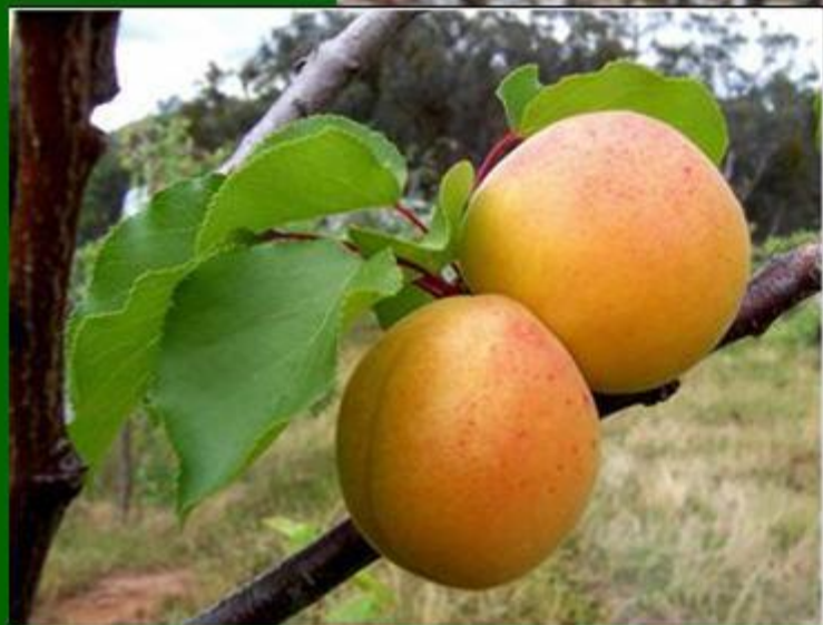
βερίκοκο, το - абрикос