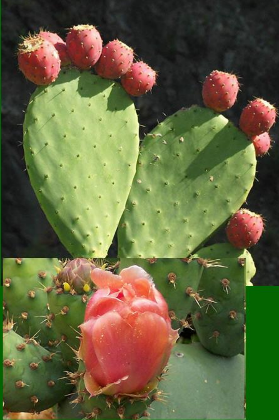
опунция (индийская смоковница)