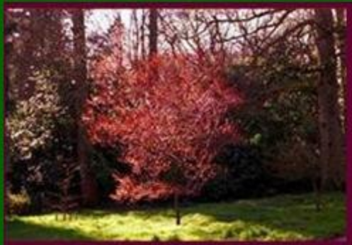
δαμάσκινο, το - слива