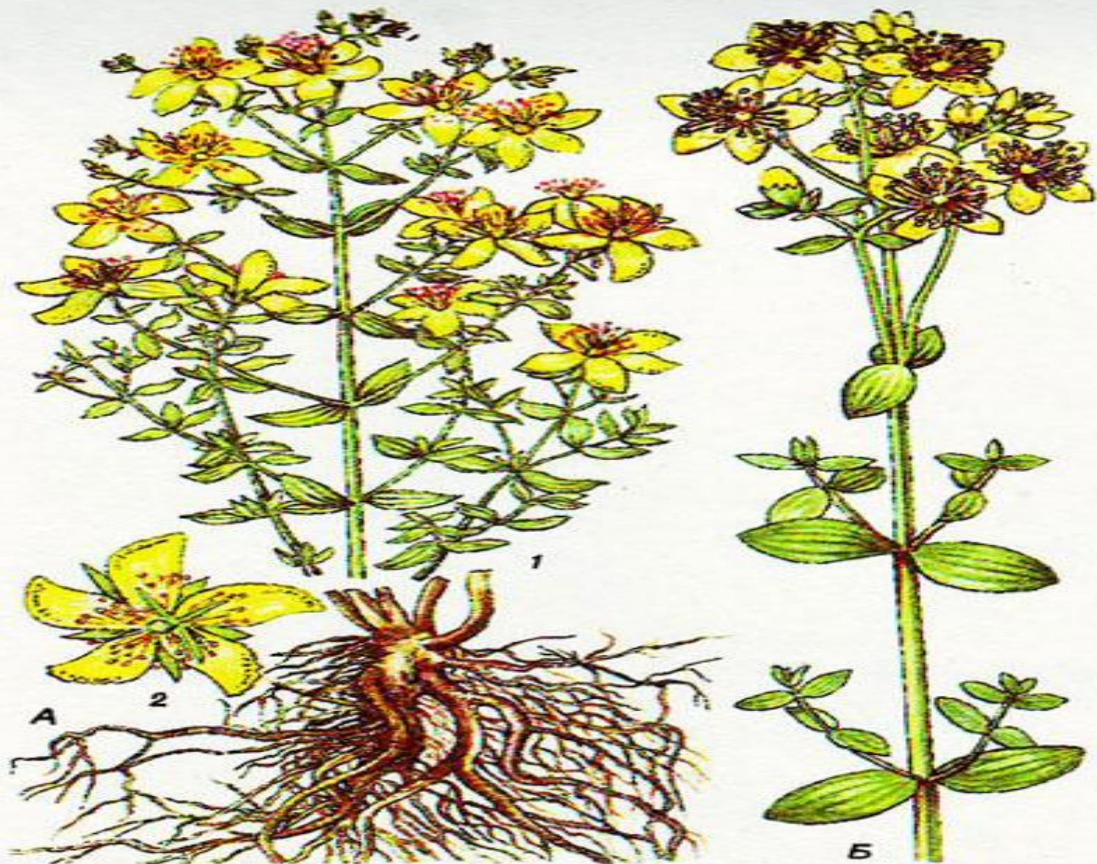
А. ЗВЕРОВОЙ ПРОДЫРЯВЛЕННЫЙ: 1 — верхушка цветущего растения и подземные органы; 2 — цветок. Б. ЗВЕРОВОЙ ПЯТНИСТЫЙ