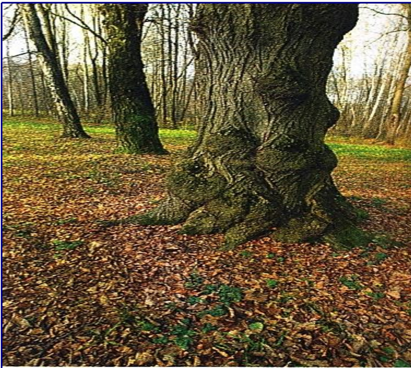
Вековой дуб в яснополянском парке.