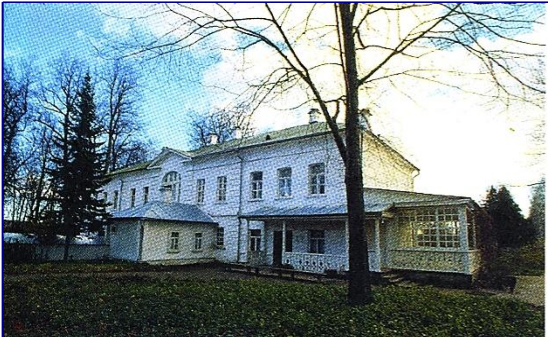
Дом Л.Н.Толстого в Ясной Поляне.