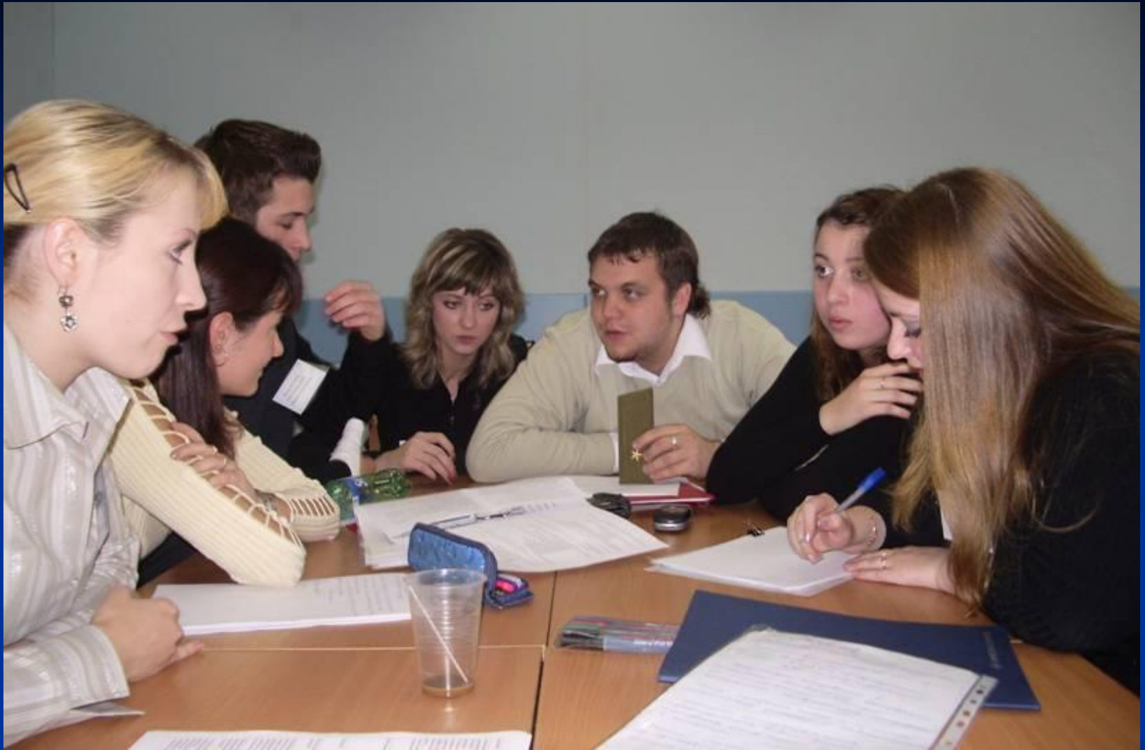
Процесс выработки командного решения в деловой игре