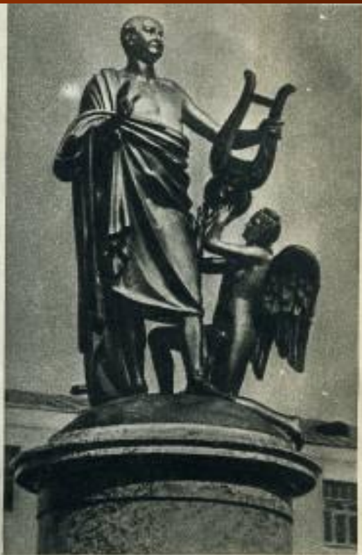
Памятник М. Ломоносову в Архангельске работы скульптора И. П. Мартоса. Фото 1950 года.