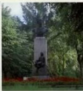
Музей М.В. Ломоносова в г. Ломоносов. Скульптор Г.Д. Гусев, 1953 г.

Указом Президиума Верховного Совета РСФСР город Ораниенбаум Ленинградской области в 1948 году был переименован в Ломоносов. Имени великого ученого названы: горный водопадный хребет в бассейне Северного Ледовитого океана, кратер на южной стороне Луны, один из малых планет и метеорит.