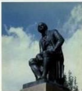
Памятник М.В. Ломоносову в г. Ломоносов. Скульптор А.В. Колосов, 1959 г.