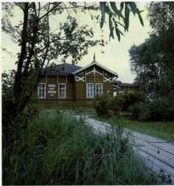
Домик Музея М.В. Ломоносова в г. Ломоносов