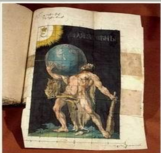
Рисунок для иллюстрации 19 декабря 1754 г., сделанный по проекту Ломоносова.

В литературном творчестве Ломоносова важное место занимают оды и стихотворные послания к востанувшим идомам, которые устраивались в честь различных событий. Произведения Ломоносова были пронизаны идеями просвещения, стремлением прославить свой народ и Родину.