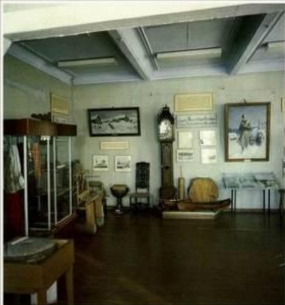
Музей М.В. Ломоносова в г. Ломоносов

Указом Президиума Верховного Совета РСФСР город Ораниенбаум Ленинградской области в 1948 году был переименован в Ломоносов. Имени великого ученого названы: горный водопадный хребет в бассейне Северного Ледовитого океана, кратер на южной стороне Луны, один из малых планет и метеорит.