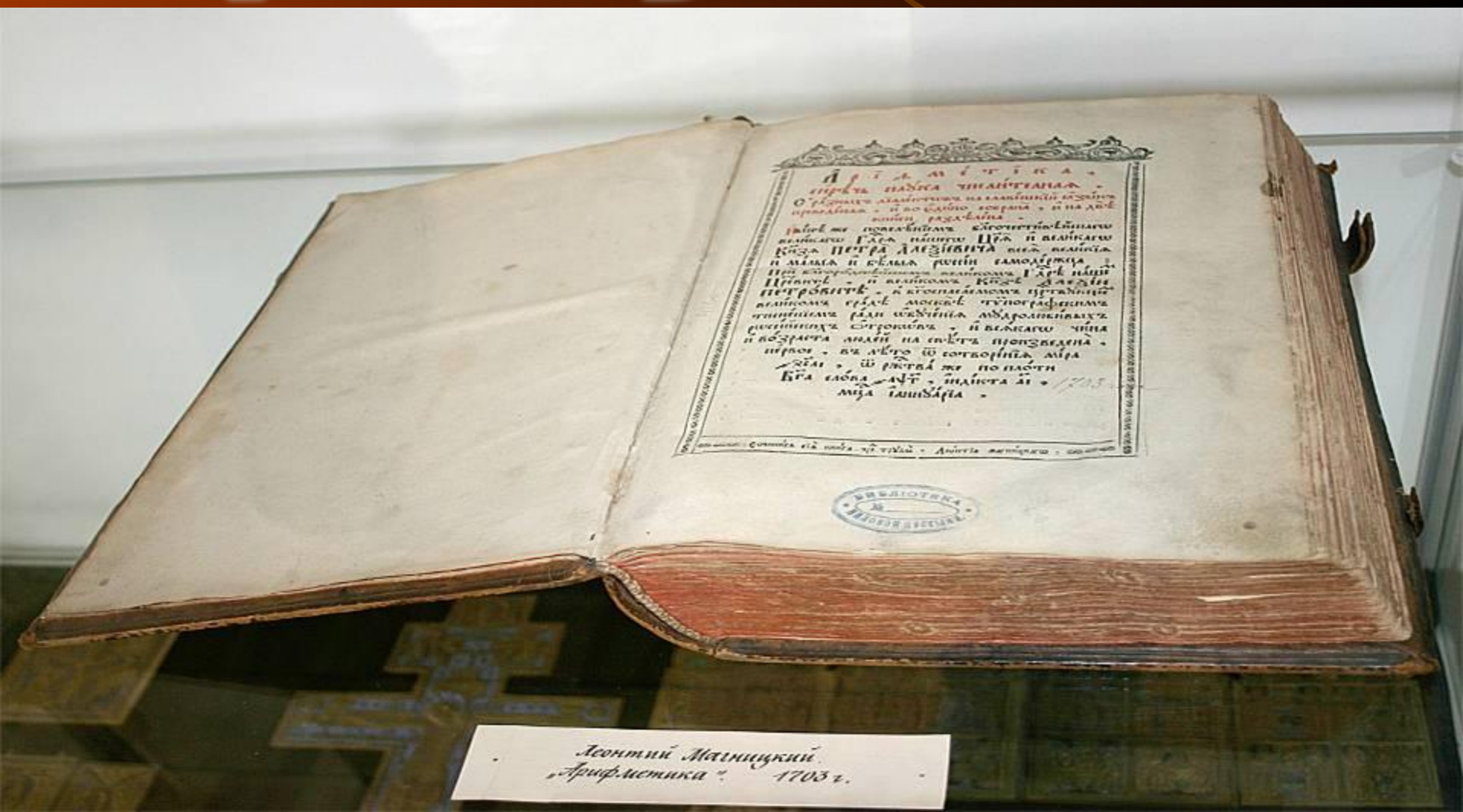
Лео́нтий Мази́нскій. „Ариф.метрика“ 1703 г.