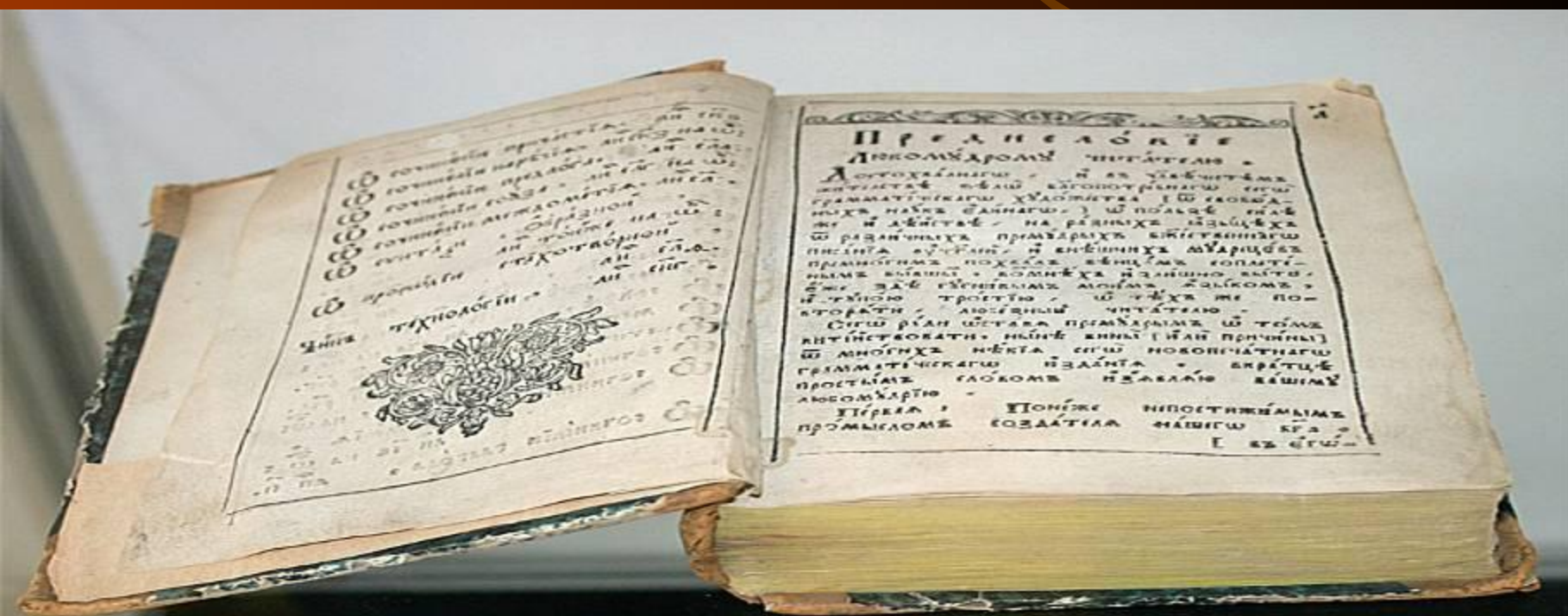
Мелетий Смотрицкий, "Грамматики российская." 1721 г.