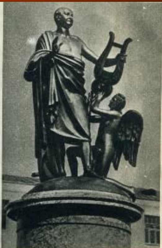
Памятник М. Ломоносову в Архангельске работы скульптора И. П. Мартоса. Фото 1950 года.