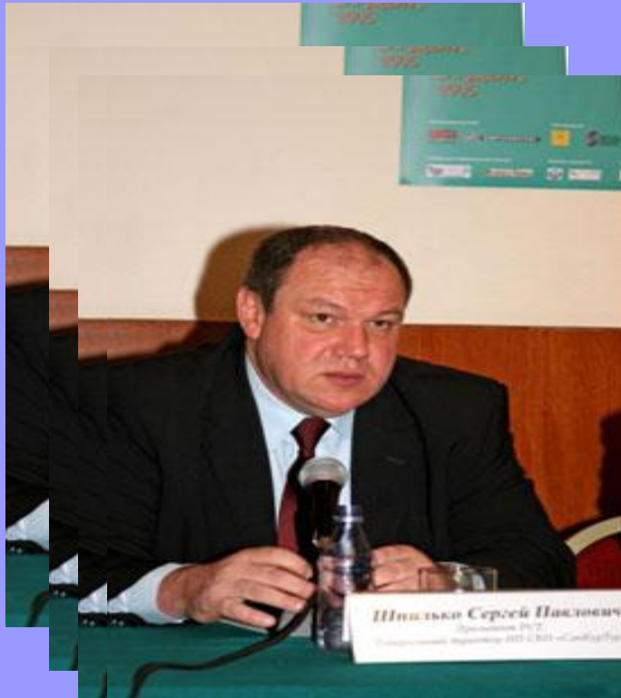
Сергей Шпилько Председатель Комитета по туризму и гостиничному хозяйству г.Москвы