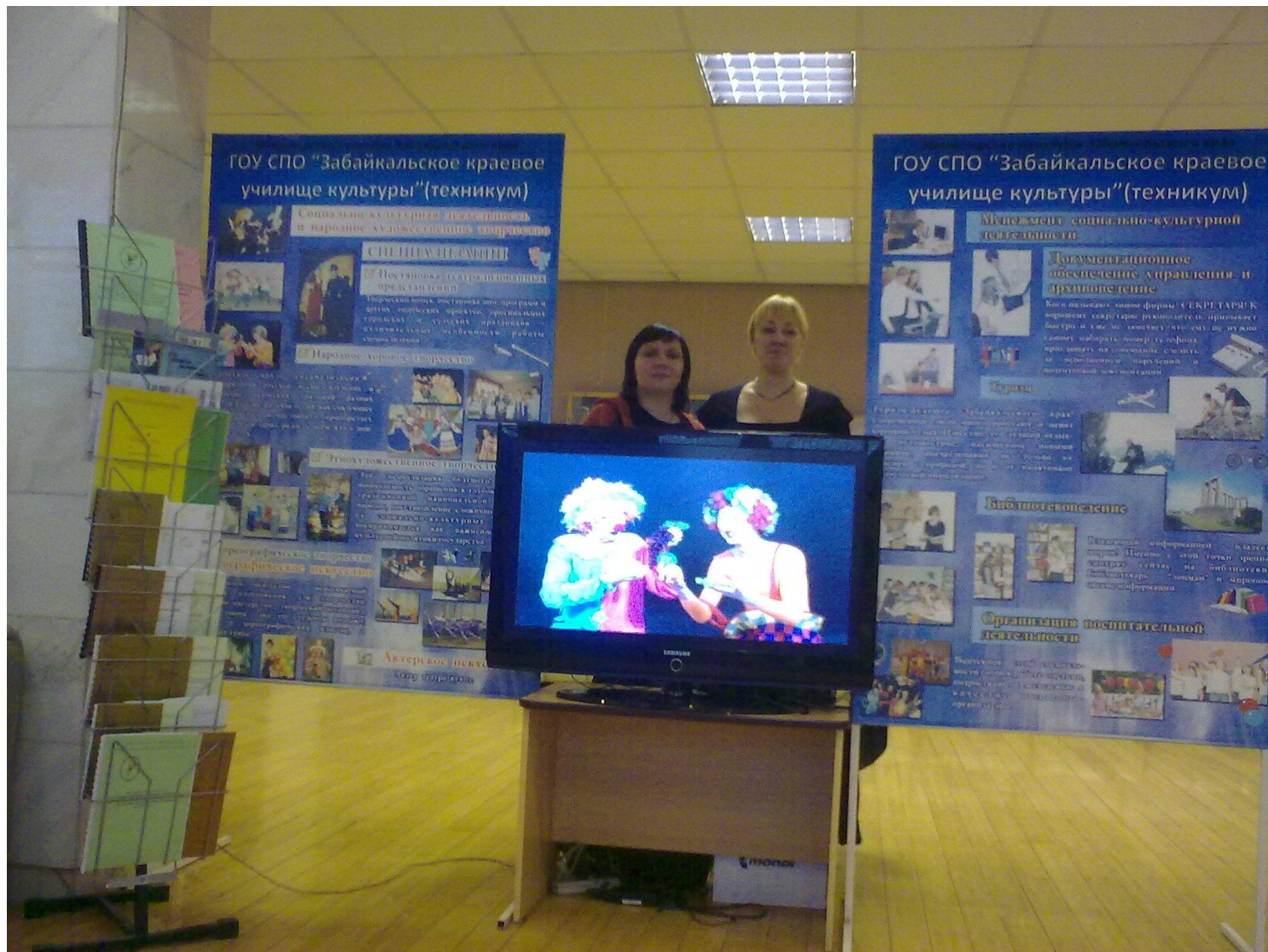
Коллегия Министерства культуры, презентационная выставка