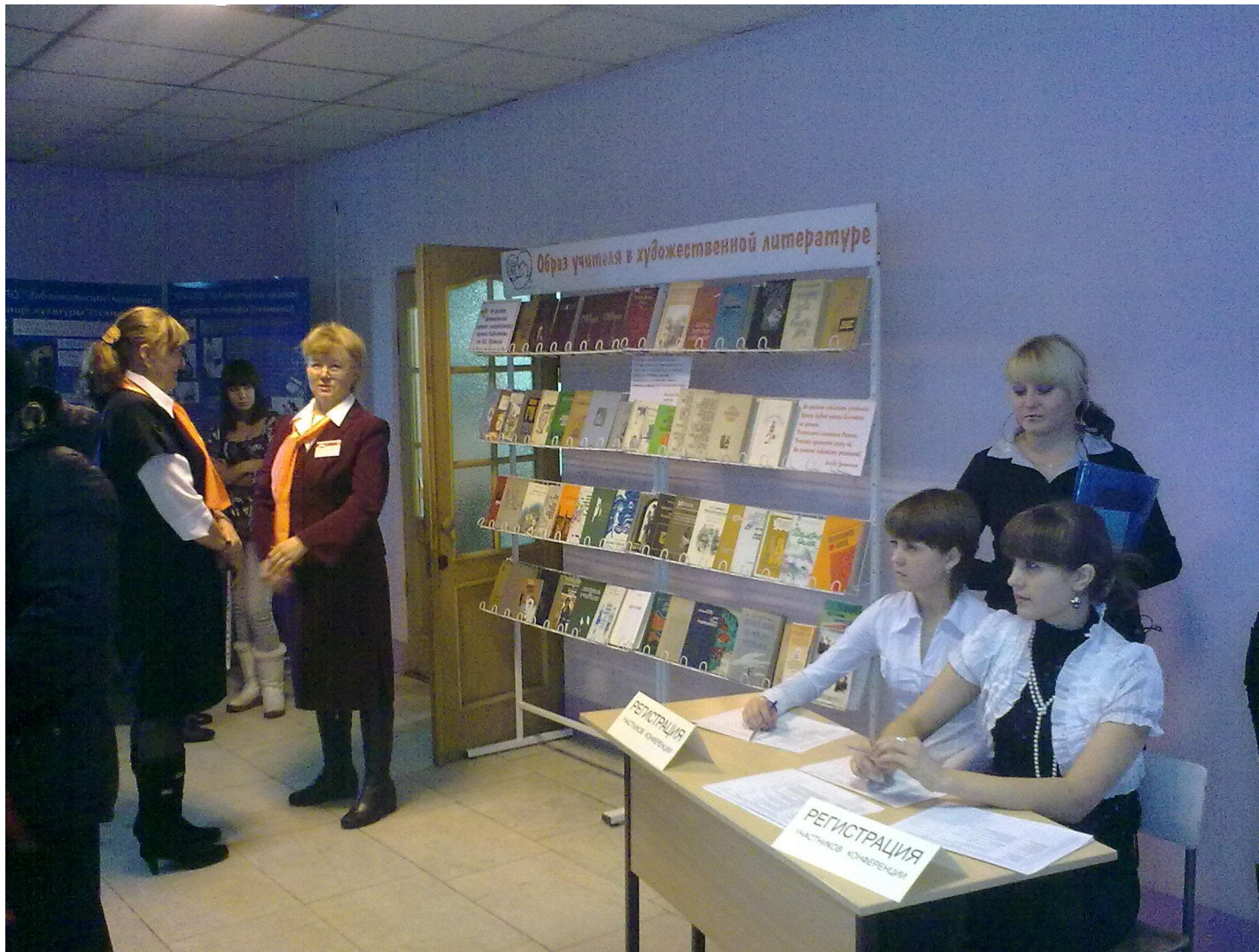
Образ учителя в общественном сознании молодежи Краевая СЯПК