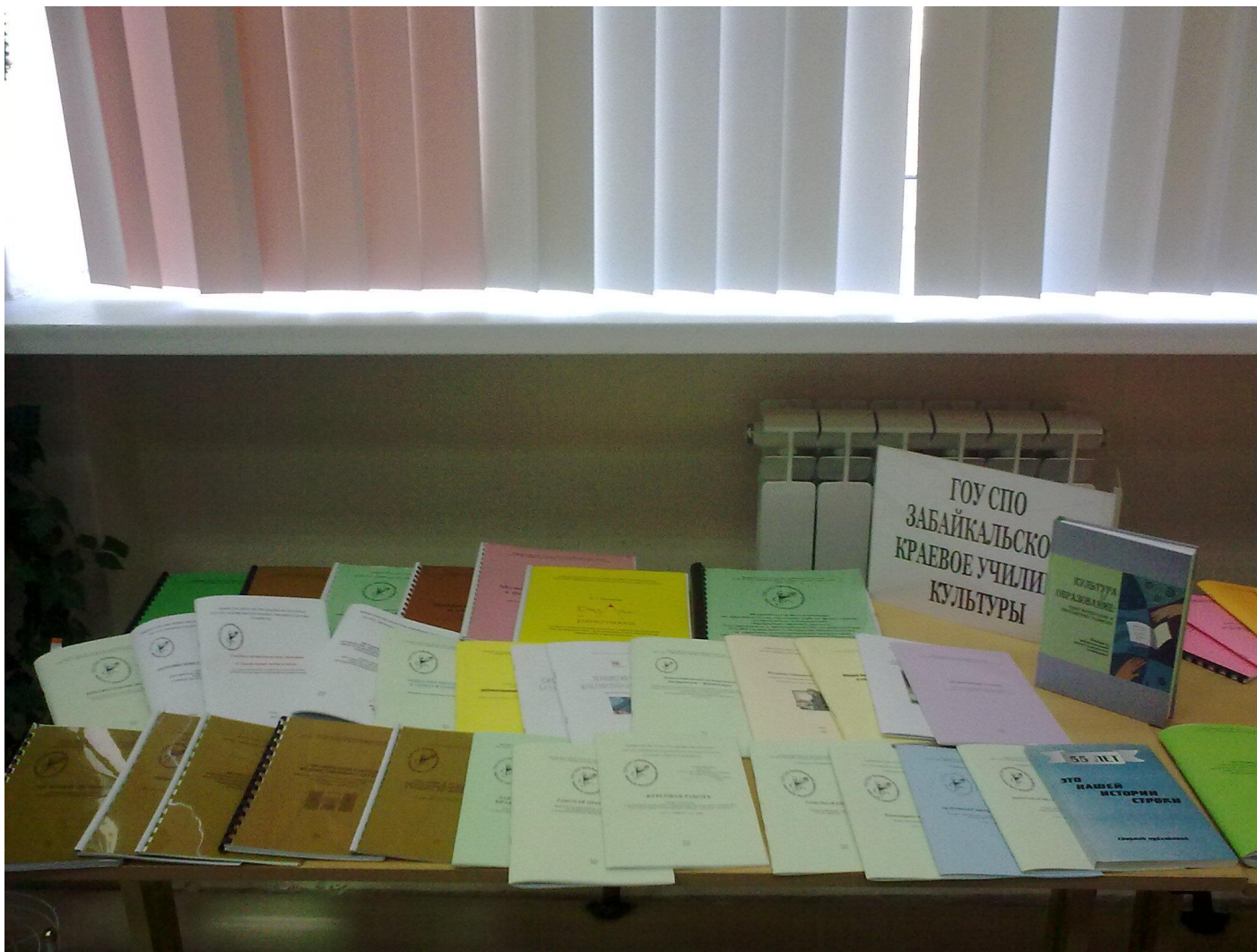
Выставка учебных и методических изданий