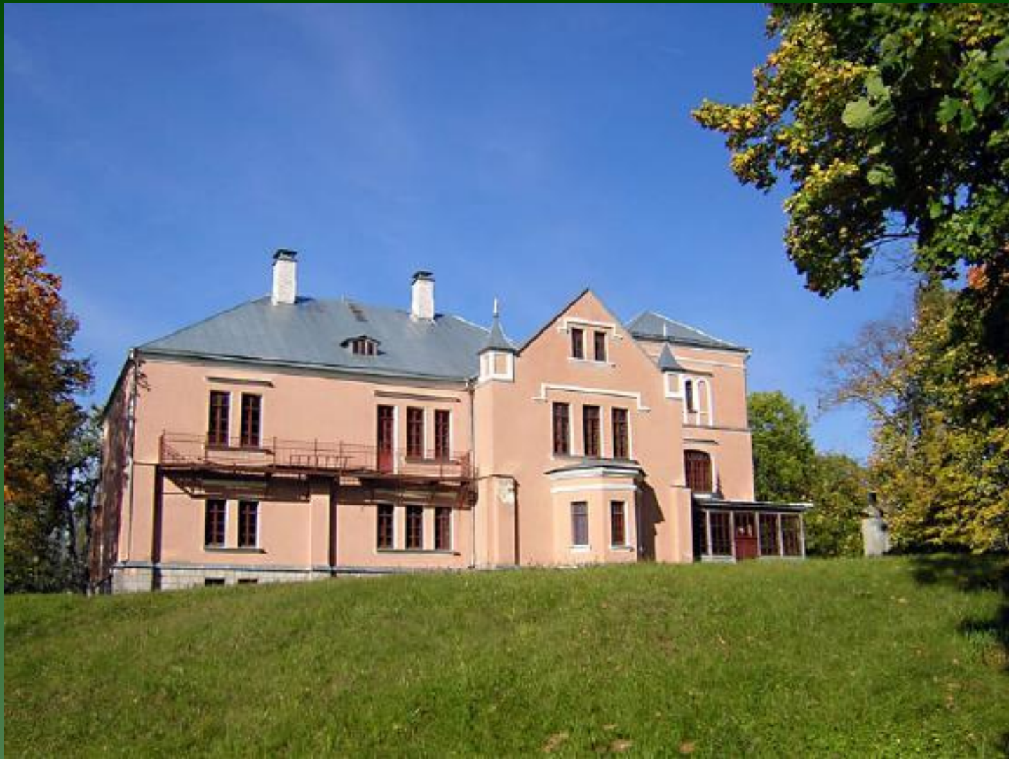
Музей-усадьба Корвин-Круковских в Полибино.