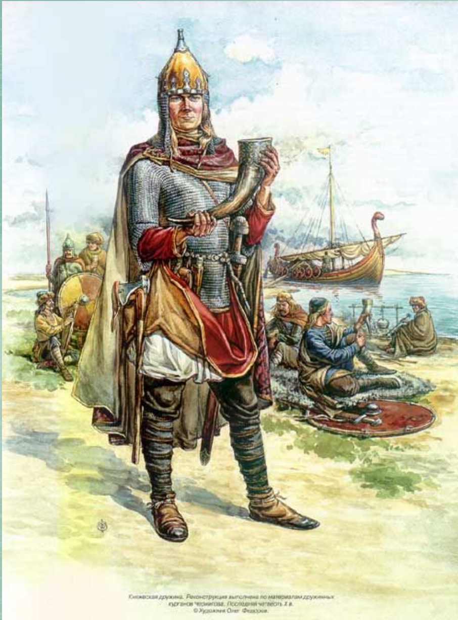
Київська дружина. Реконструкція виконана за матеріалами дружинних курганів Черняхів. Остання чверть Х в. © Художник Олег Фішкін.

907 г. – торговый договор, который содержал выгодные для русских купцов условия;