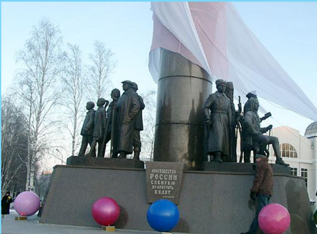
Монумент «Бронзовый символ Югры»