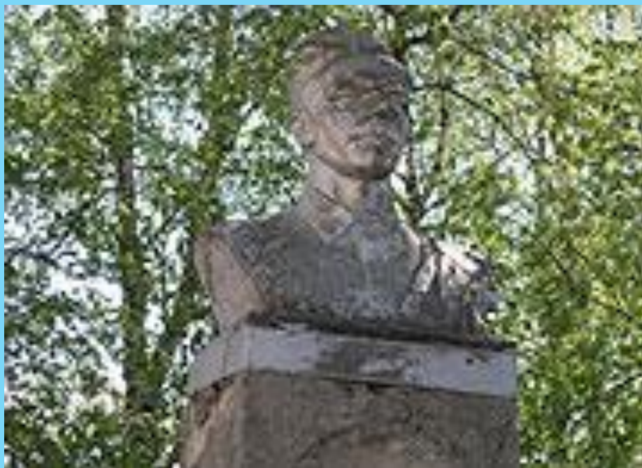
Памятник П.И.Лопареву, герою гражданской войны