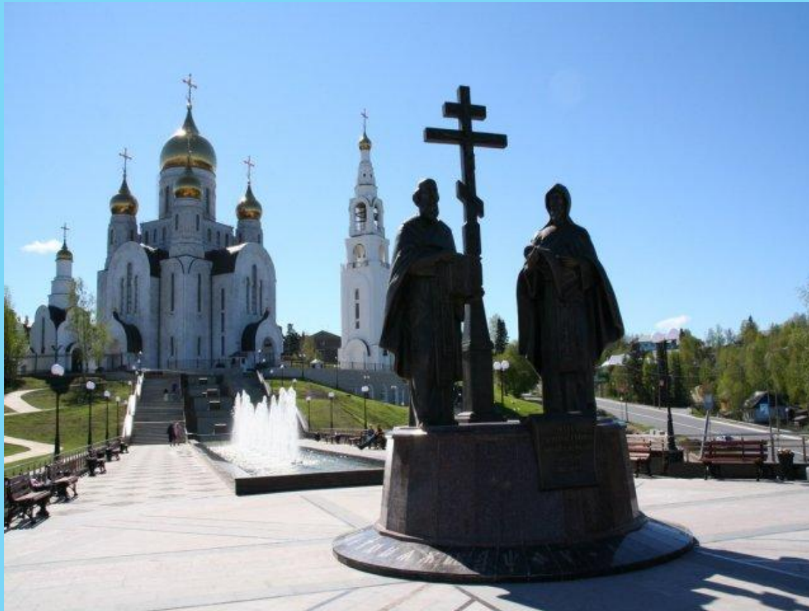
Памятники святым равноапостольным Кириллу и Мефодию