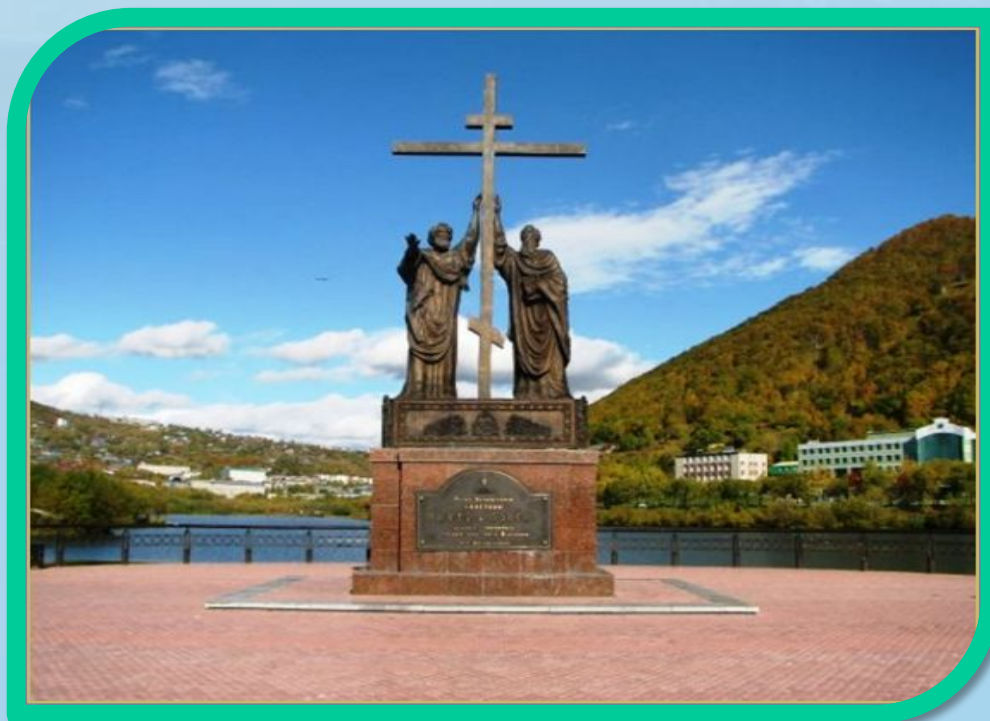
Памятник Святому Петру и Павлу

Один из самых старых городов на Дальнем Востоке. В 1740 год сюда прибыла вторая Камчатская экспедиция под руководством Витуса Беринга и Алексея Чирикова. Название наш город получил от имён кораблей Святой апостол Пётр и Святой апостол Павел.