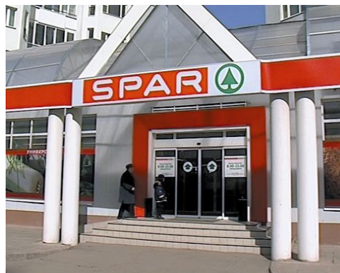
Сеть супермаркетов SPAR