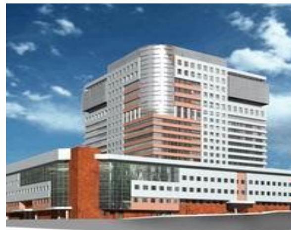
Торговый центр «ЧЕРЕМУШКИ»