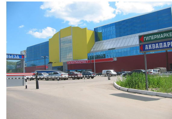
Торгово-развлекательный центр «Парк-Хаус»