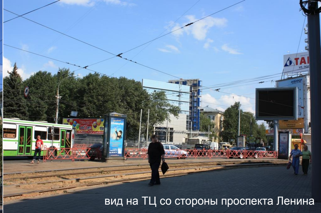
вид на ТЦ со стороны проспекта Ленина