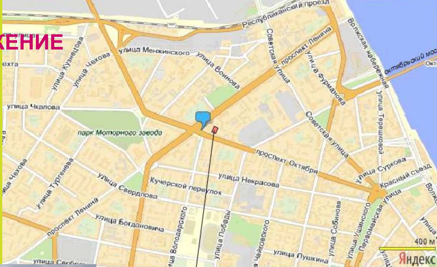
Место расположения торгового центра

ТЦ «Гигант» расположен в историческом центре города. На пересечение главных улиц: проспекта Ленина и проспекта Октября в зоне интенсивных пешеходных потоков.