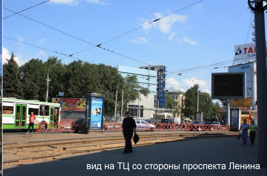
вид на ТЦ со стороны проспекта Ленина