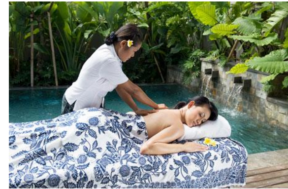
In Villa Spa