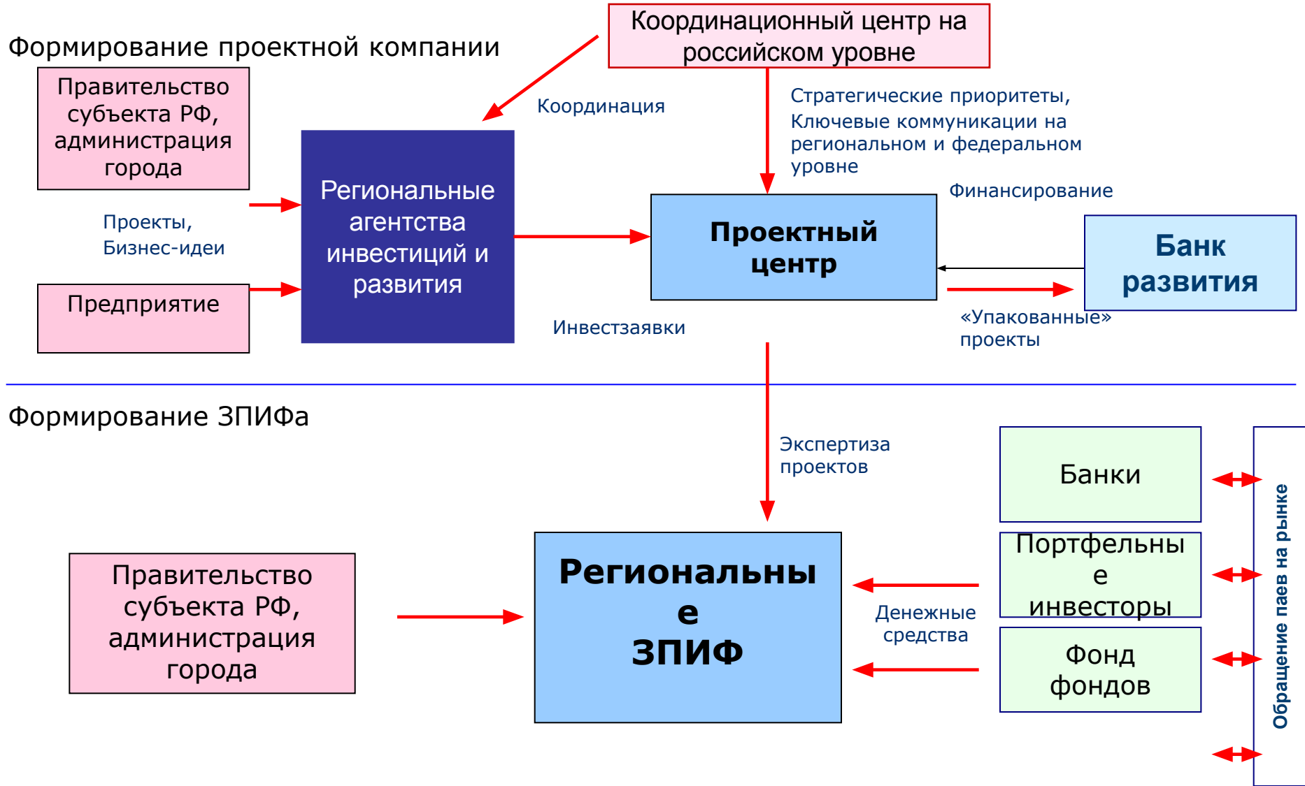
Схема подготовки и финансирования проектов в сфере ГЧП