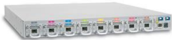
Optical Networking & CWDM Platforms

Соединяем компании и сообщества при помощи качественного, надежного и защищенного оборудования, обеспечивающего пользователей необходимыми сервисами