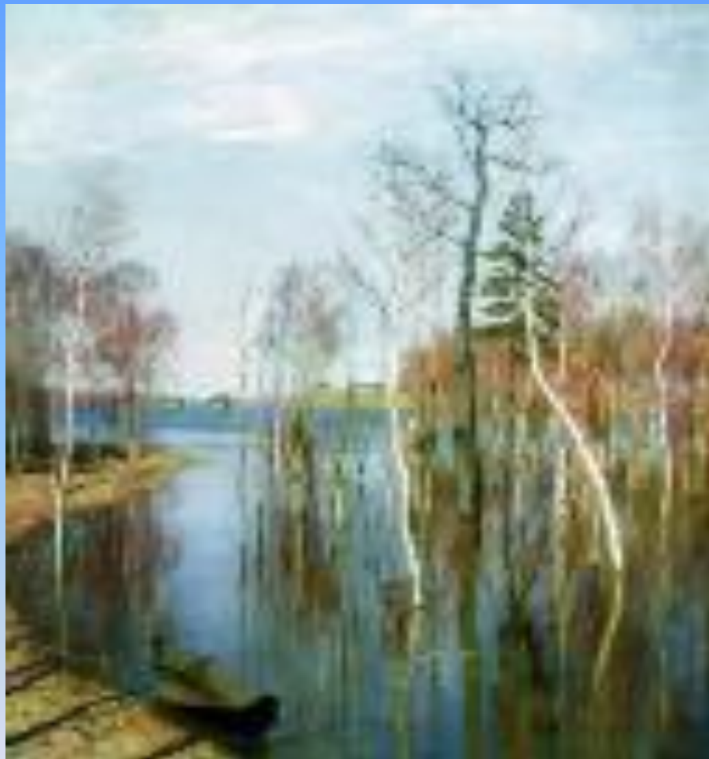
Весна. Большая вода