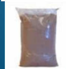
Песок для фильтра