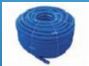
Разрезной соединительный шланг для фильтров и насосов