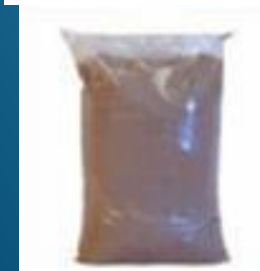
Песок для фильтра