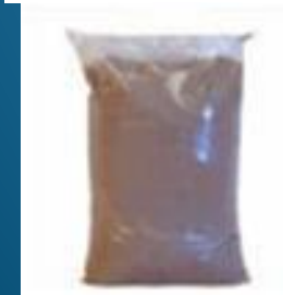
Песок для фильтра