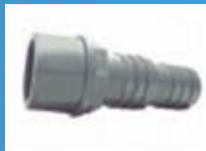
Штуцерное соединение для шлангов