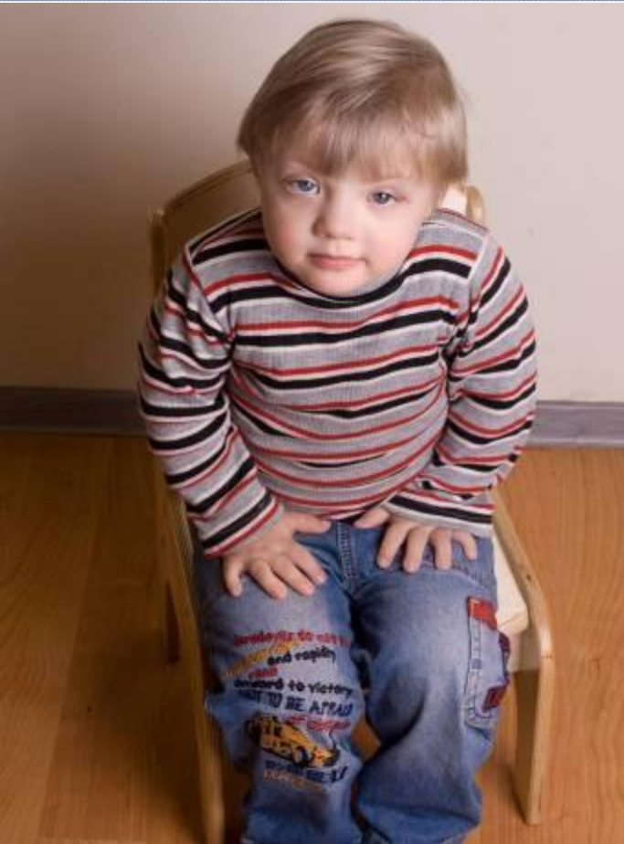
Футбольный манеж «Динамо» 7 ноября 2010

Только 15% бюджета Даунсайд Ап покрывает государство, остальной бюджет формируется из пожертвований частных лиц и компаний и грантов.