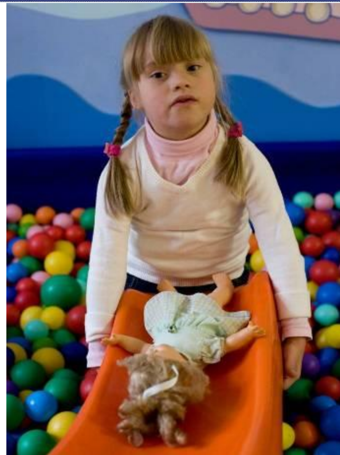
Футбольный манеж «Динамо» 7 ноября 2010

В 2010 году благотворительный фонд «Даунсайд Ап» бесплатно помогает 1969 семьям из Москвы и 80 регионов России и СНГ