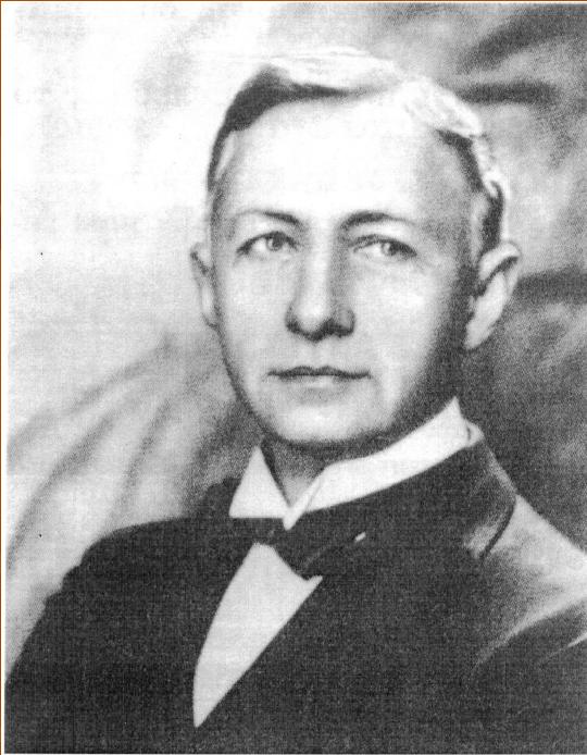
ИВАН АЛЕКСЕЕВИЧ БУНИН 1870 - 1953