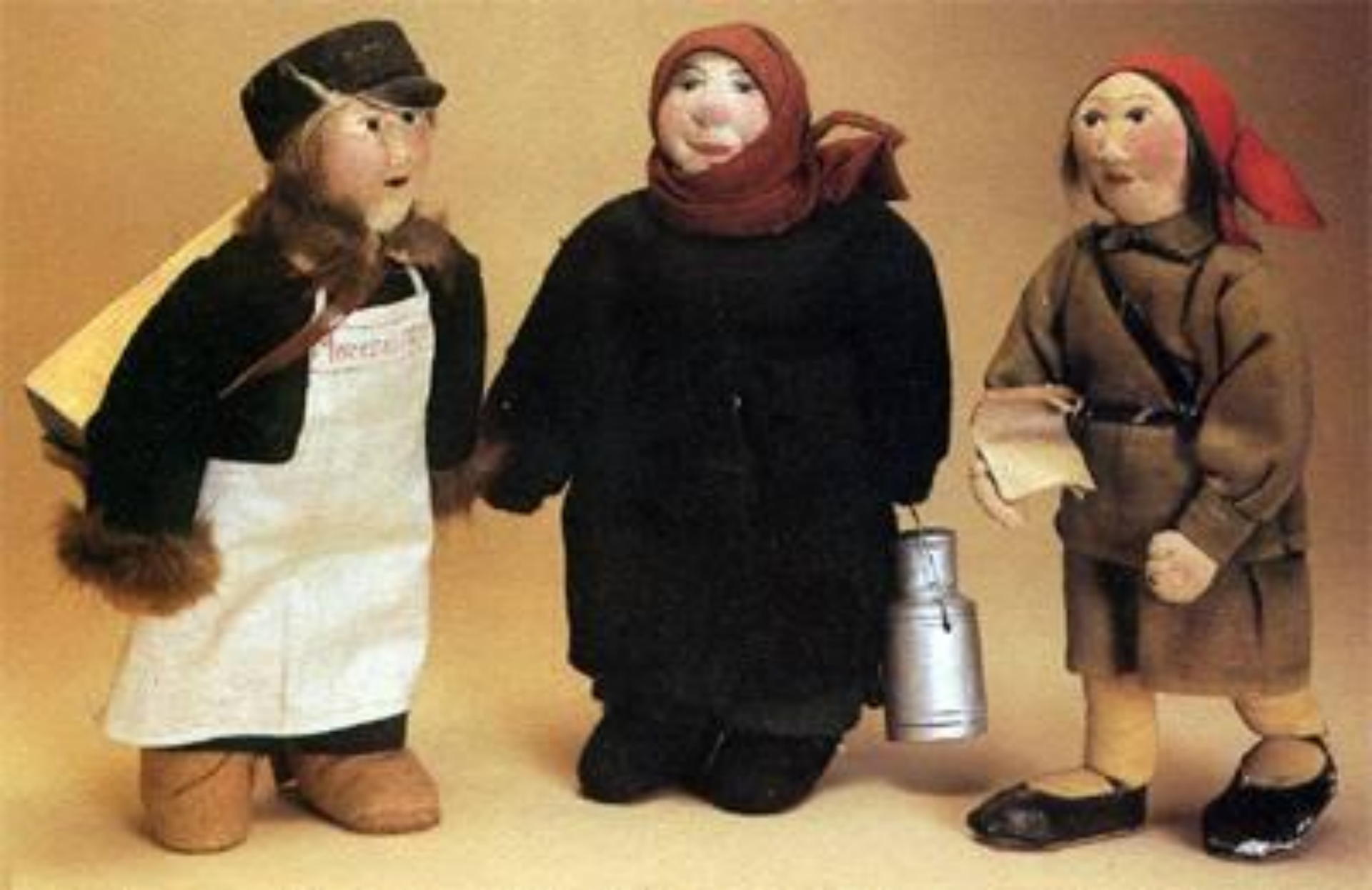
Куклы: 1920 г. «Артель», ткань, трикотаж, вата, вышивка.