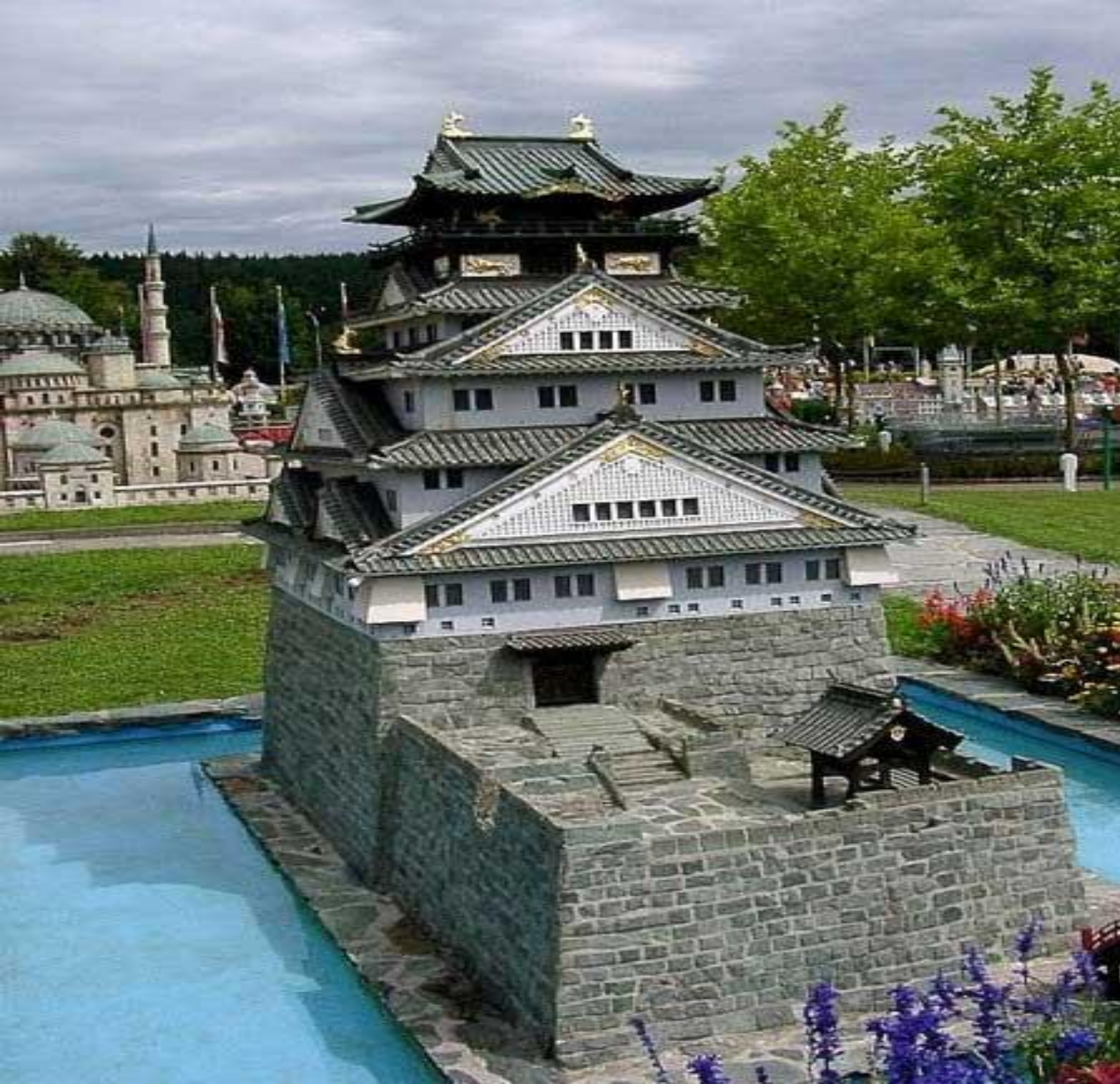
Копия замка из японского города Осака.