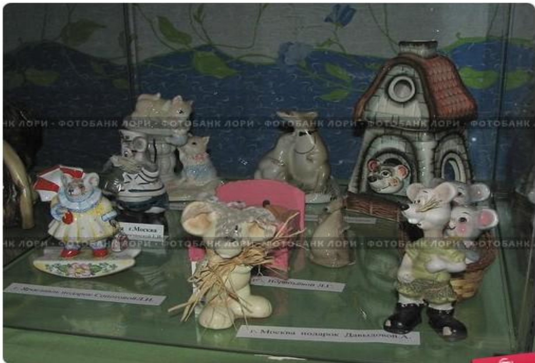
Мышкин: в музее Мыши - статуэтки мышей