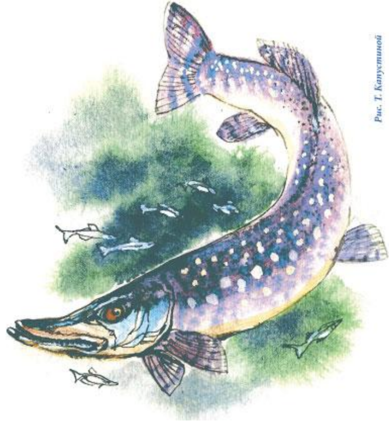
Рис. Т. Канустиной