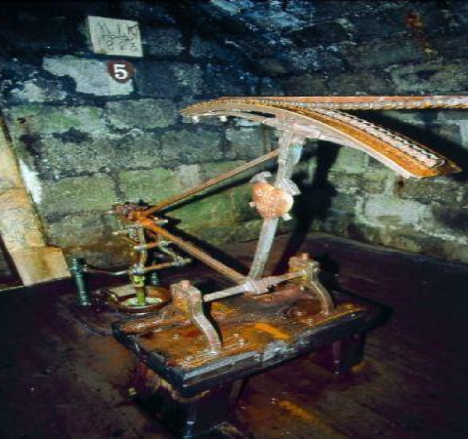
Установка для добычи каменной соли.