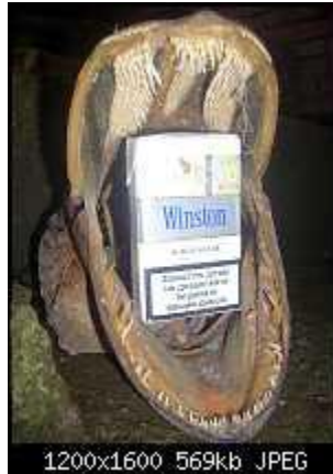
1200x1600 569kb JPEG