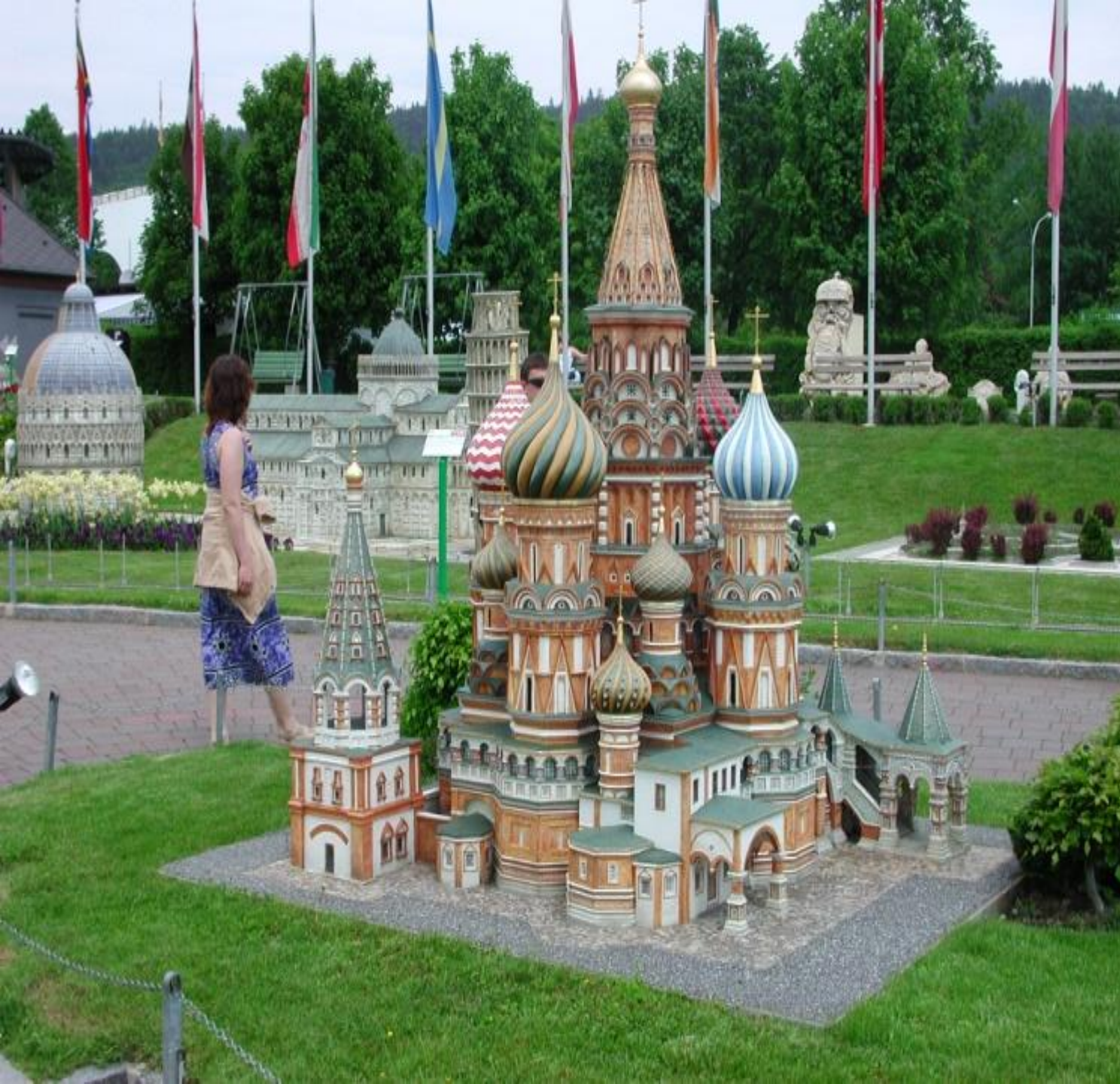
Копия московского храма Василия Блаженного