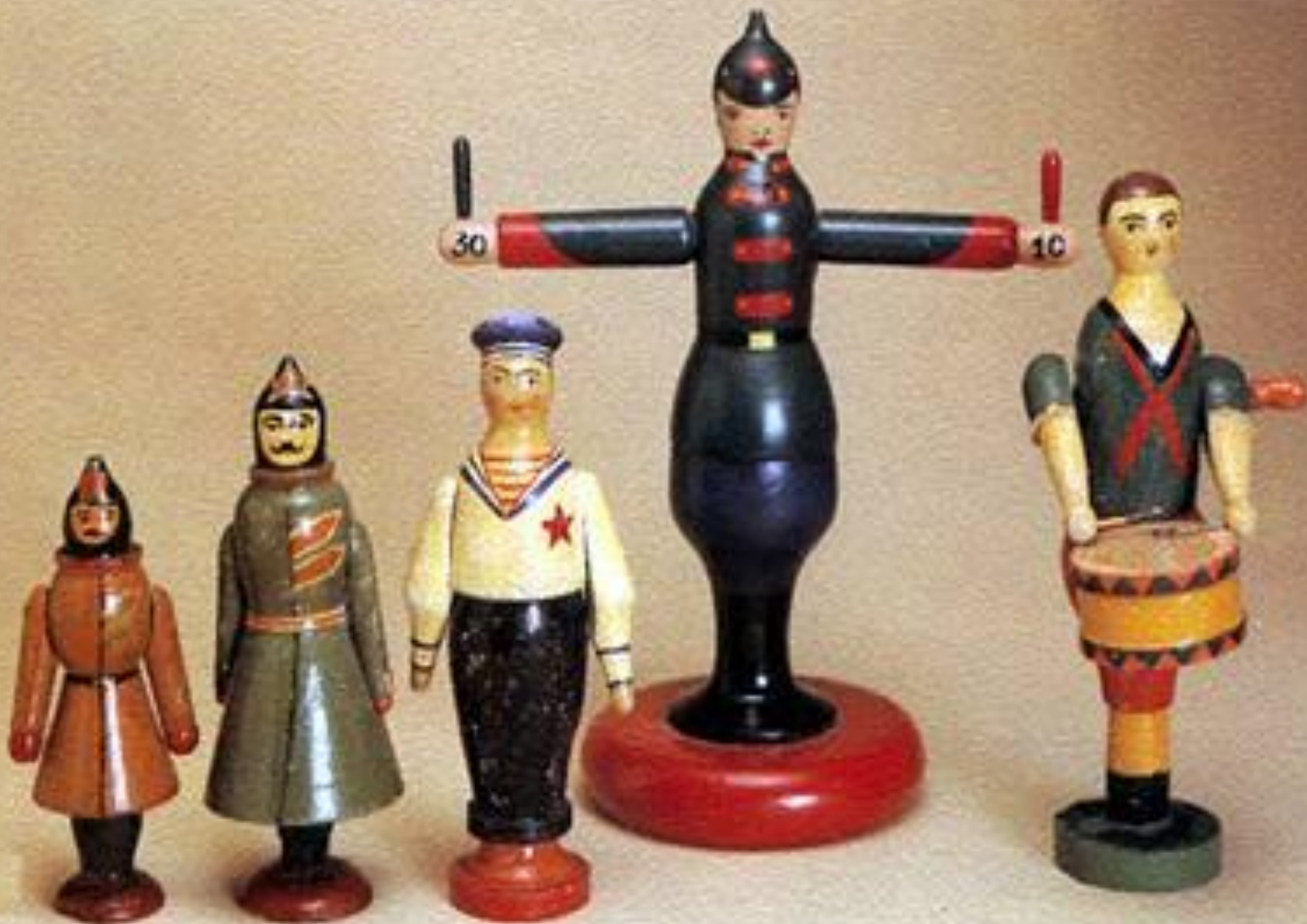
Красноармейцы, матрос, барабанщик: 1930 г. дерево, точение, окраска, роспись.