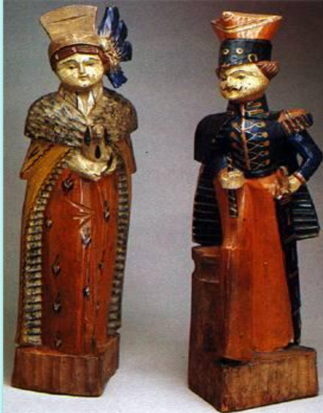
Дама и гусар: первая половина 19 века. Дерево, резьба, роспись.