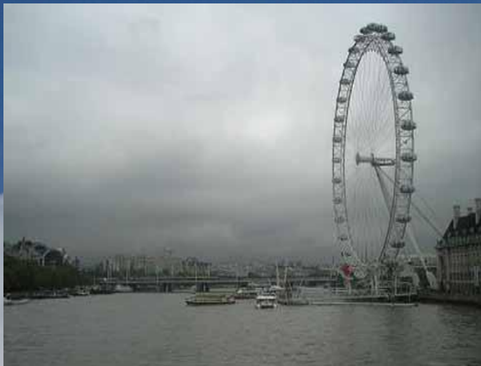
Колесо обозрения, Лондон