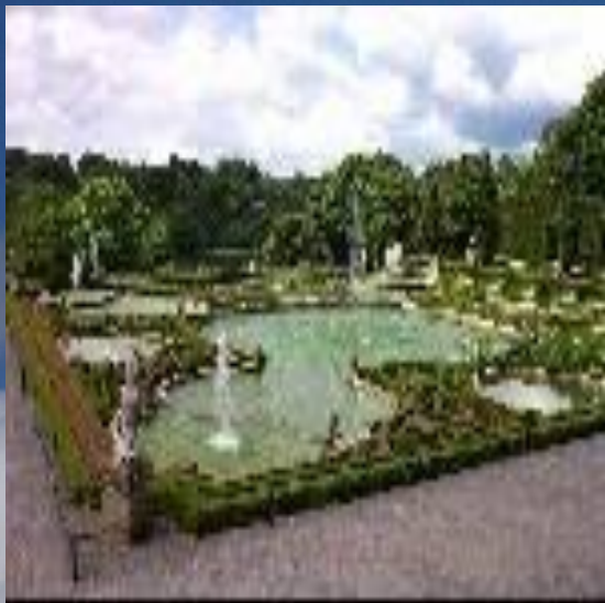
Парк дворца Блейнхейм