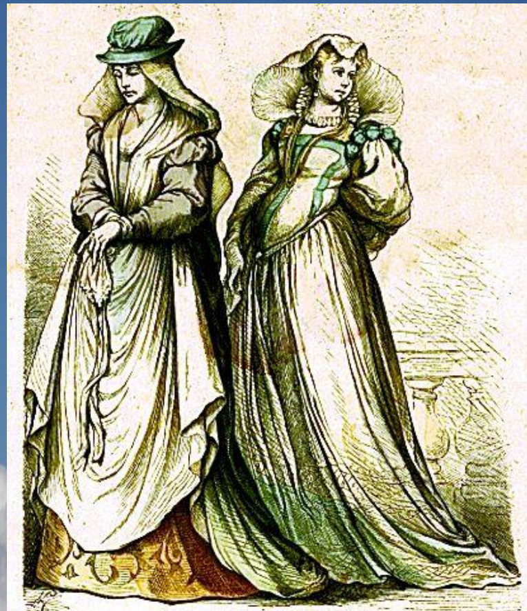
Florenz und Padua.