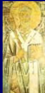
Южная внутренняя галерея. Святой Фока. Фреска XI ст