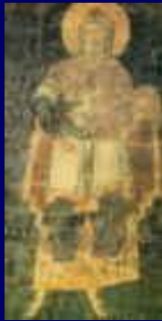
Михайловский Златоверхий Собор. Святой Захария. Фреска XII ст