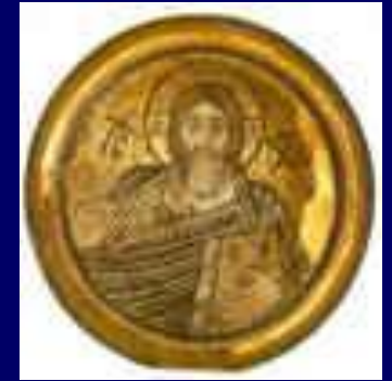
Главная баня. Пантократор. Мозаика. XI ст