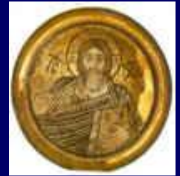
Главная баня. Пантократор. Мозаика. XI ст