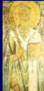
Южная внутренняя галерея. Святой Фока. Фреска XI ст