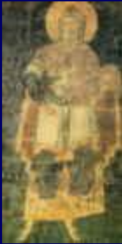
Михайловский Златоверхий Собор. Святой Захария. Фреска XII ст